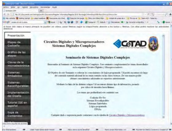
Figura 3: implementación de un curso utilizando Ardora®, herramienta que permite armar contenidos WEB 2.0

La base de conocimientos adquiridos relativa a los medios digitales proporciona la oportunidad para su estudio en función de la naturaleza, expresión y modificación de los fenómenos cognitivos involucrados.