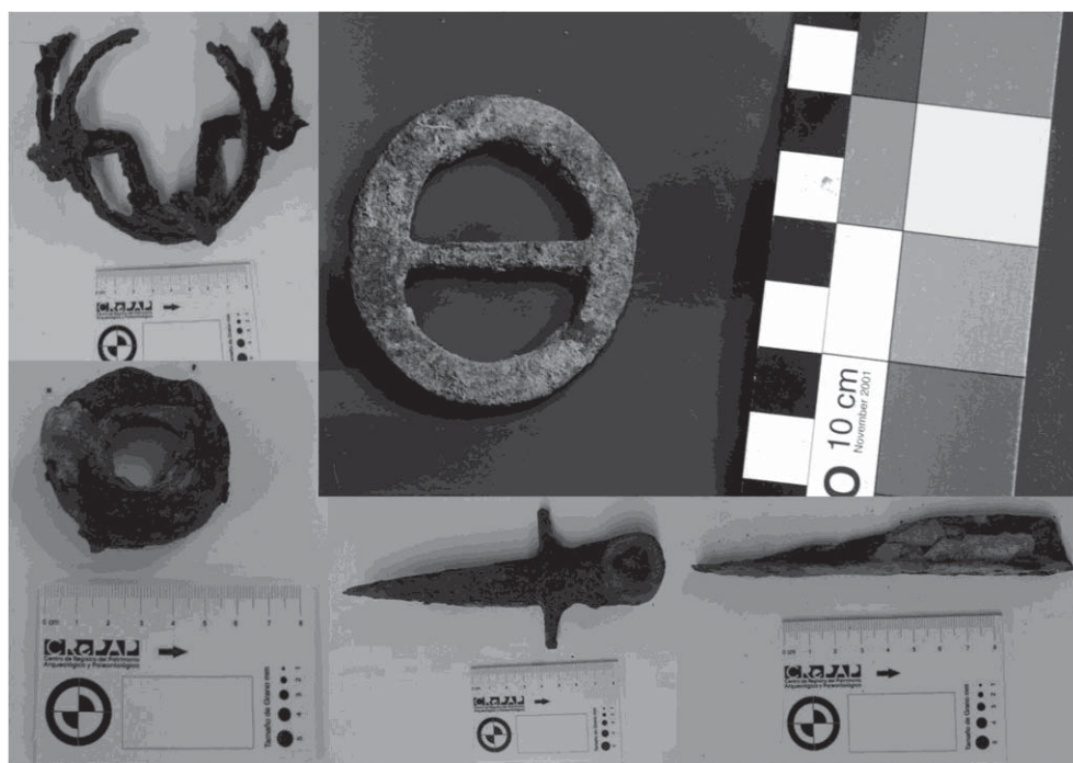
Figura 2. Elementos metálicos recuperados en la cuadrícula 6 del sitio Gascón 1

indígena de Gascón 1, se puede relacionar con aquella recuperada en sitios post-contacto del norte de la provincia del Neuquén (Hadjuk, 1991) y en sitios “araucanizados” de la Región Pampeana (Mazzanti, 1999). Con respecto a la práctica de la deformación artificial craneana en forma tabular erecta de los individuos de Gascón, es comparable a otras muestras correspondientes al Holoceno tardío final (ca. 2.000a 400 años AP), entre las cuáles pueden mencionarse Laguna Los Chilenos, Napostá, La Petrona (Barrientos, 2001; Martínez y Figuerero Torres, 2000). Sin embargo, la forma de los dientes incisivos en pala y doble pala, revelan diferencias con las poblaciones estudiadas del Holoceno tardío final, ya que en el área este rasgo se encuentra ausente (Oliva et al. , 2007).