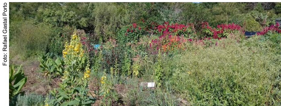
Figura 13.1. Experiência da Horta Comunitária da Lomba do Pinheiro em Porto Alegre/RS

Outra estratégia utilizada pela coordenação do Projeto foi conhecer outras experiências exitosas nas diversas regiões do Brasil, visando o intercâmbio e trocas de conhecimentos e saberes, com base nas realidades locais (Figuras 13.1, 13.2, 13.3, 13.4, 13.5 e 13.6).