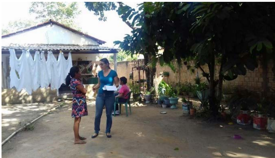
Figura 4.1. Diagnóstico Rápido Participativo pela aplicação de questionário via entrevista presencial às famílias participantes do Projeto Quintais Sustentáveis com o objetivo de conhecer a realidade e definir a instalação das hortas, em Boa Vista/RR