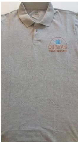
Figura 6.2. Camiseta do Projeto Quintais Sustentáveis para a equipe técnica