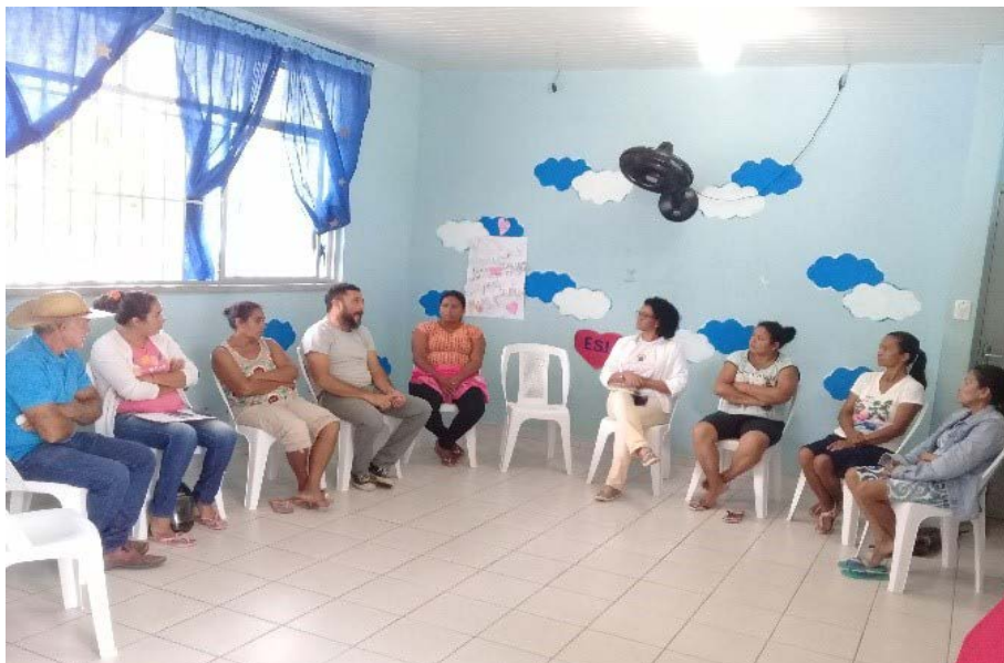
Figura 2.2. Reunião entre equipe técnica do Projeto Quintais Sustentáveis com as famílias dos participantes no Lar Fabiano de Cristo, em Boa Vista/RR