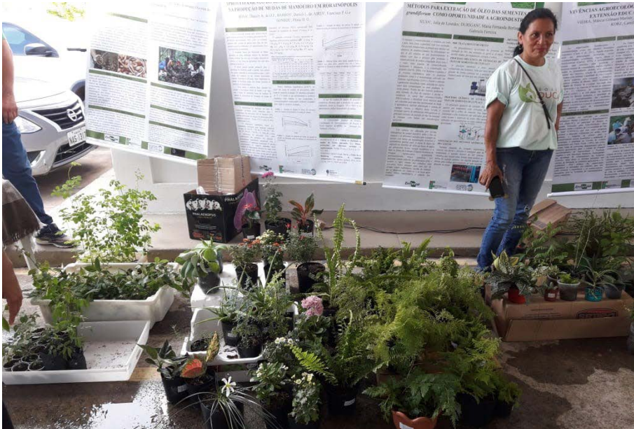
Figura 10.1. III Simpósio de Agroecologia da UERR contemplando o Projeto Quintais Sustentáveis em Boa Vista/RR