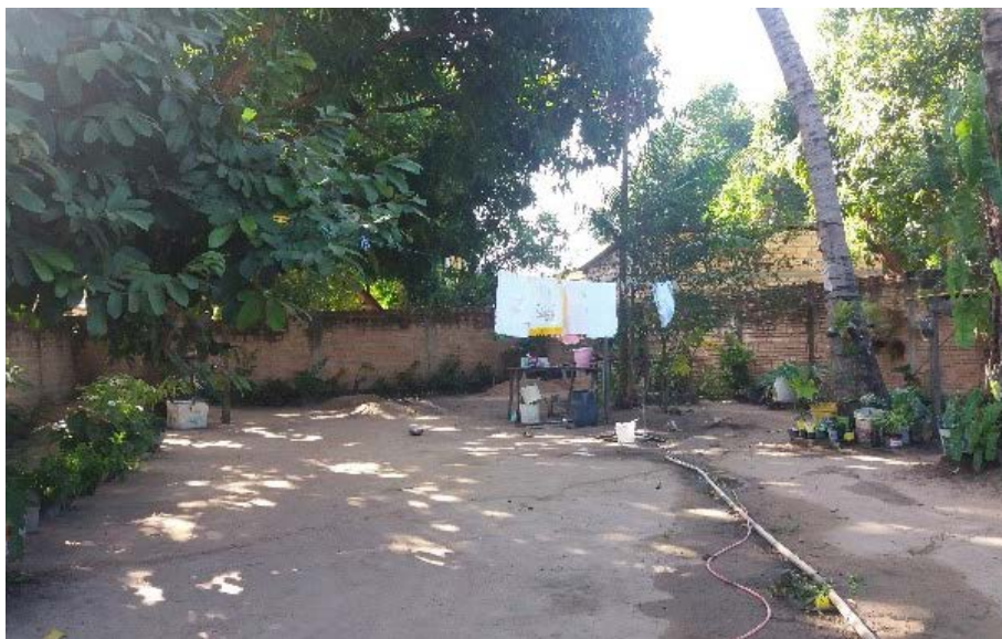
Figura 3.1. Visitas às famílias participantes do Projeto Quintais Sustentáveis com o objetivo de planejar a instalação das hortas, em Boa Vista/RR