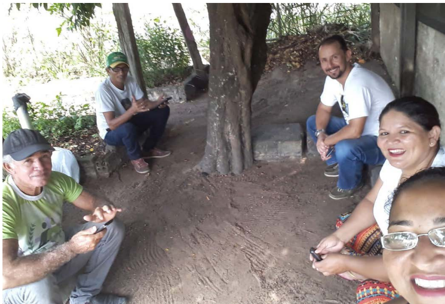
Figura 2.5. Reunião entre equipe técnica do Projeto Quintais Sustentáveis com os bolsistas no Lar Fabiano de Cristo, em Boa Vista/RR