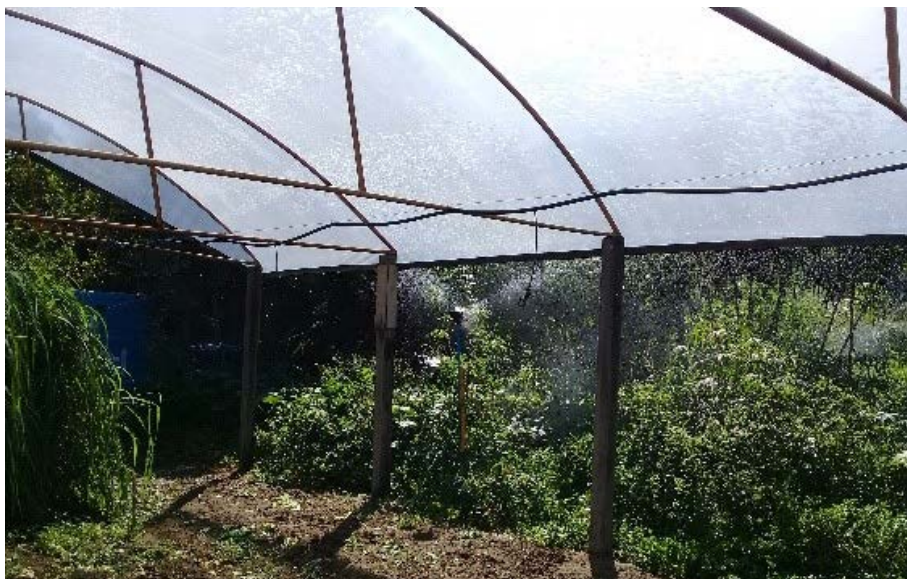
Figura 12.1. Recuperação de sistema de irrigação automatizado pelo Projeto Quintais Sustentáveis (Lar Fabiano de Cristo) em Boa Vista/RR