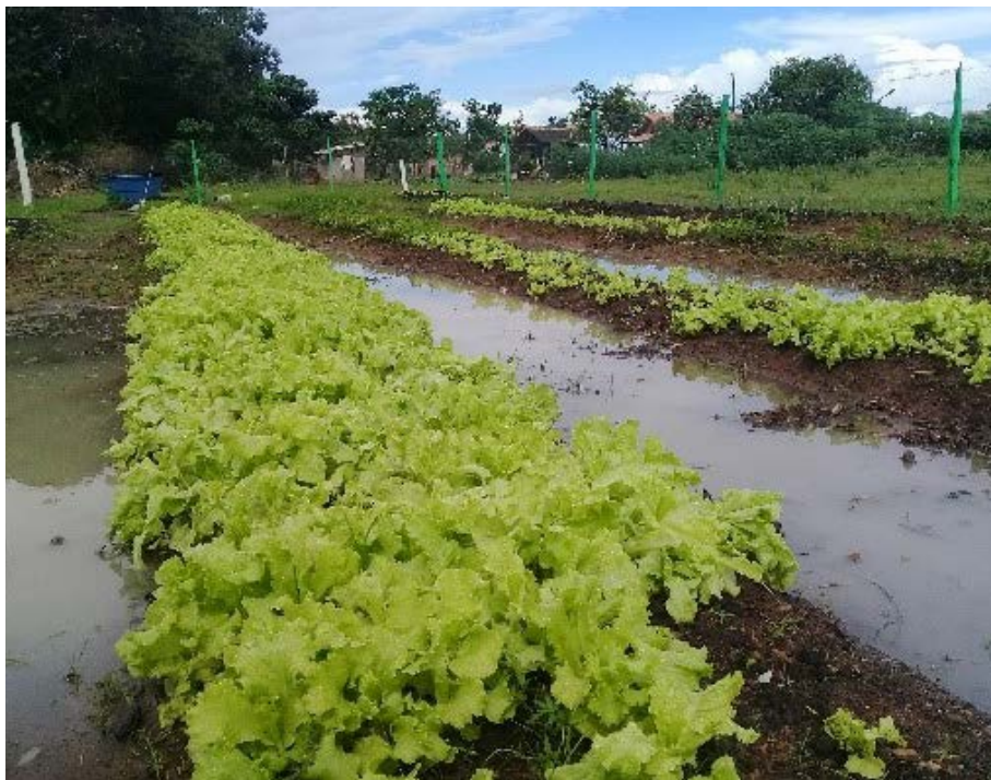
Figura 14.2. Comunidade Indígena do Sucuba, Alto Alegre/RR, horta após 30 dias de instalação coletiva pelo Projeto Quintais Sustentáveis em 2019