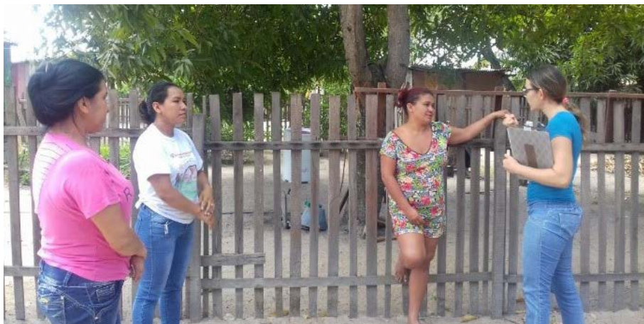
Figura 4.2. Diagnóstico Rápido Participativo pela aplicação de questionário via entrevista presencial às famílias participantes do Projeto Quintais Sustentáveis com o objetivo de conhecer a realidade e definir a instalação das hortas, em Boa Vista/RR

No DRP pode-se observar, de forma geral, que a maioria das famílias selecionadas (15), ao redor de 85% apresenta grau de escolaridade entre ensino fundamental e médio, tanto incompleto quanto completo, com pequenos graus de variação. No que tange à renda familiar, 90% auferem entre menos