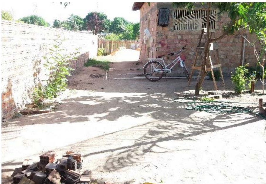
Figura 3.4. Visitas às famílias participantes do Projeto Quintais Sustentáveis com o objetivo de planejar a instalação das hortas, em Boa Vista/RR