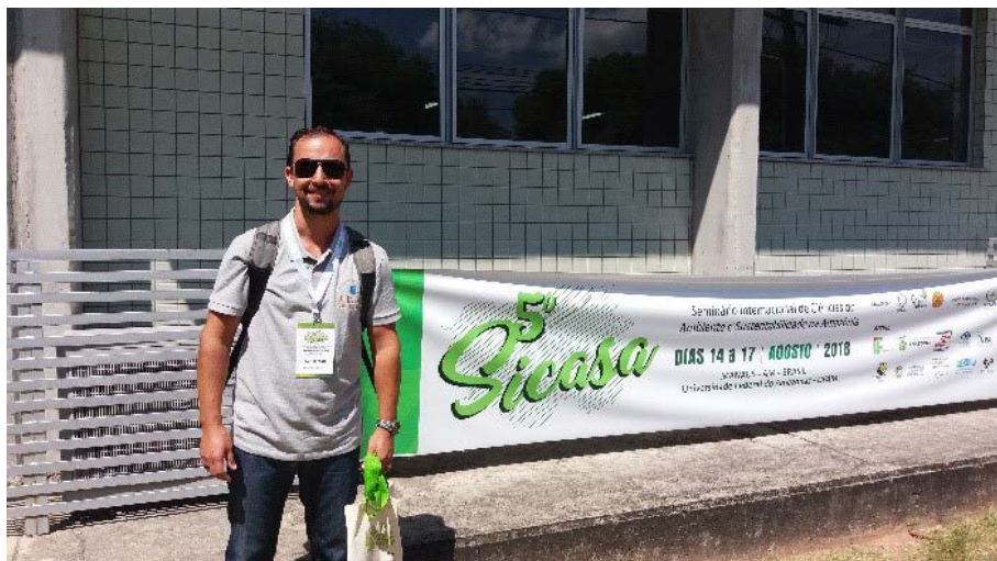
Figura 13.4. Participação no SICASA 2018 na UFAM em Manaus/AM