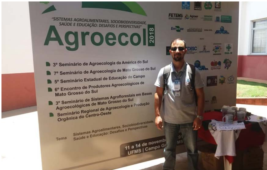
Figura 13.3. Participação no AGROECOL 2018 na UFMS em Campo Grande/MS