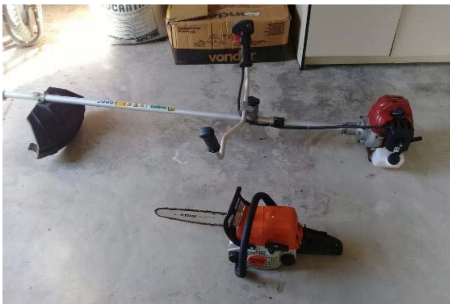
Figura 12.2. Equipamentos, ferramentas e maquinários adquiridos pelo Projeto Quintais Sustentáveis (Lar Fabiano de Cristo) em Boa Vista/RR