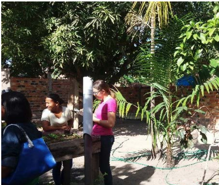
Figura 3.5. Visitas às famílias participantes do Projeto Quintais Sustentáveis com o objetivo de planejar a instalação das hortas, em Boa Vista/RR