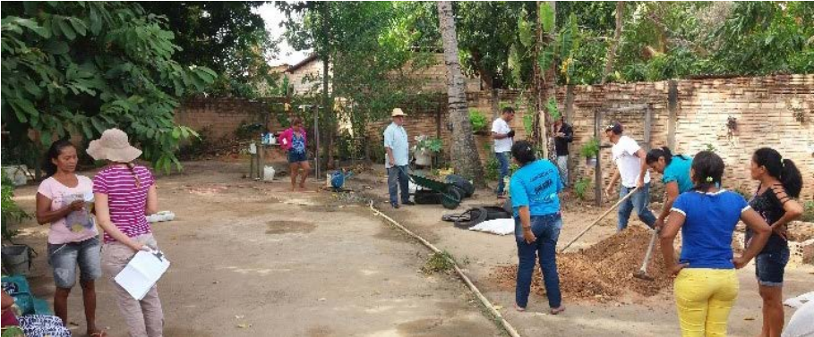
Figura 5.2. Atividade de Instalação (em mutirão) do Projeto Quintais Sustentáveis nas residências das famílias participantes, em Boa Vista/RR