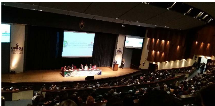
Figura 13.6. Participação no Congresso AGURB 2018 na UFRGS em Porto Alegre/RS

Após a divulgação de algumas matérias jornalísticas, tanto no Portal da Embrapa quanto na mídia local, o Projeto foi contatado por setores da comunidade que traziam demandas relacionadas ao trabalho com as hortas orgânicas. Assim ocorreu com a Comunidade do Sucuba, de Alto Alegre/RR, comunidade indígena que tem um projeto do Programa Nacional de Habitação Rural (PNHR) – via Caixa Econômica Federal – sendo capitaneado pelo Instituto Socioambiental Observatório da Amazônia, com sede em Boa Vista/RR, a qual trouxe a demanda de um curso a ser realizado para os indígenas. Após tratativas e oficialização via convite à Embrapa Roraima, o Projeto Quintais Sustentáveis, conseguiu atender esta comunidade na oferta do Curso de “Produção de Hortaliças Orgânicas em base comunitária” (Figuras 14.1 e 14.2).