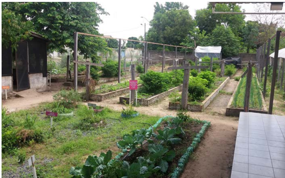
Figura 1. Unidade Casa de Timóteo (Lar Fabiano de Cristo) em Boa Vista/RR

A horta e o pomar possibilitam uma melhoria na qualidade da alimentação das crianças e, ao mesmo tempo, proporcionam uma mudança de hábitos e adoção de gostos alimentares saudáveis, além de contribuir na diminuição dos custos com a manutenção alimentar das crianças, gerando assim recursos para outras atividades.