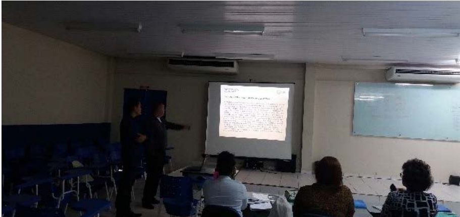
Figura 11. Defesa de TCC pelo Curso do SENAR-RR sobre o Projeto Quintais Sustentáveis em Boa Vista/RR

Concomitante às ações e atividades desenvolvidas pelo Projeto nas mais diversas frentes de atuação e formas participativas, também houve o investimento na recuperação de um sistema de irrigação automatizado na Casa de Timóteo (Lar Fabiano de Cristo) por ser a base do Projeto em que se dava todo apoio necessário. Portanto, além do sistema de irrigação também foi adquirido com recursos do Projeto diversas ferramentas, utensílios e maquinários no sentido de qualificar os processos de trabalho conduzidos nas hortas, bem como, servir de ajuda na consecução de tarefas inerentes ao Projeto (Figuras 12.1, 12.2 e 12.3). Além, obviamente, da aquisição de materiais de consumo (composto, sementes, esterco).