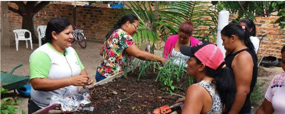
Figura 5.3. Atividade de Instalação (em mutirão) do Projeto Quintais Sustentáveis nas residências das famílias participantes, em Boa Vista/RR

Ao longo da realização das atividades do Projeto, mais especificamente, na metade do ano de 2018, ocorreu um acontecimento quase que natural, tanto por parte da percepção da equipe técnica, quanto das famílias que passaram a experimentar, que foi uma migração das hortaliças convencionais para as chamadas hortaliças não convencionais ou PANC's ou ainda, como outros autores e pesquisadores alcunham, como sendo as hortaliças tradicionais.