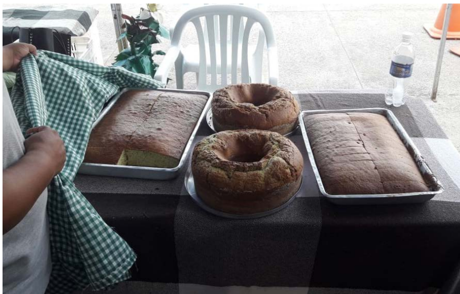
Figura 10.4. Venda de produtos pelas famílias do Projeto Quintais Sustentáveis no III Simpósio de Agroecologia da UERR em Boa Vista/RR