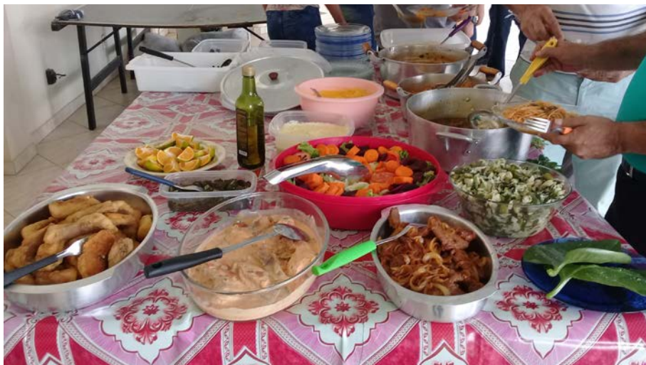
Figura 8.3. Curso de Segurança Alimentar, Nutrição e a Inserção de Hortaliças Não Convencionais na Alimentação pelo III Simpósio de Agroecologia da UERR contemplando o Projeto Quintais Sustentáveis (Embrapa Roraima) em Boa Vista/RR

Canais da mídia local, como rádio e TV, também fizeram matérias relacionadas ao Projeto no intuito de divulgar e dar ciência à comunidade local (Figuras 9.1 e 9.2). A equipe criou um perfil do Projeto no Instagram com a intenção de divulgar o trabalho.