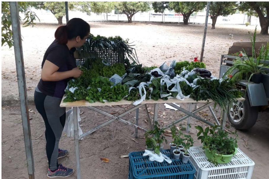
Figura 15.2. Feira Agroecológica da Embrapa Roraima pelo Projeto Quintais Sustentáveis em Boa Vista/RR