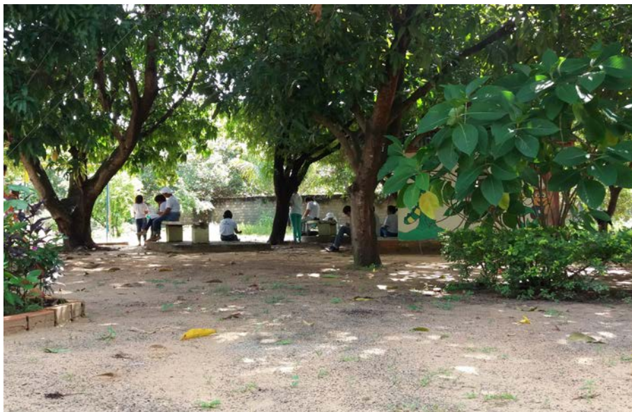
Figura 2.1. Reunião para Atividade de Interação entre equipes dos Projetos (Educar e Quintais Sustentáveis) com colaboradores do Lar Fabiano de Cristo, em Boa Vista/RR