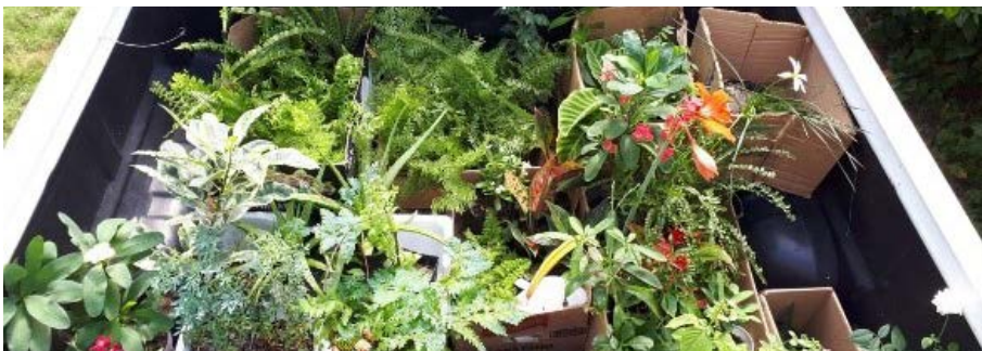
Figura 10.2. Transporte das mudas de hortaliças, plantas e flores para o III Simpósio de Agroecologia da UERR em Boa Vista/RR