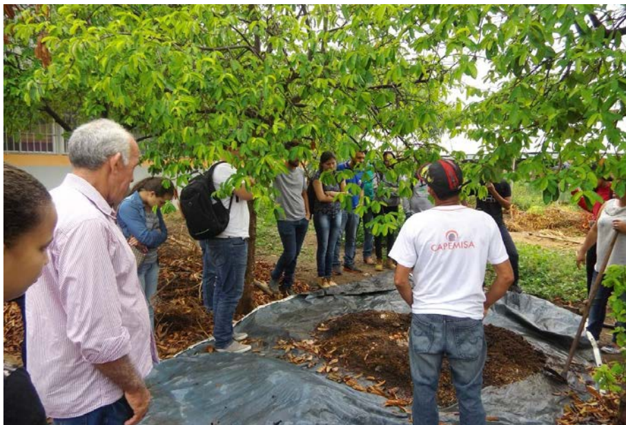
Figura 7.2. Visita da EAGRO/UFRR para conhecer os Projetos Educar e Quintais Sustentáveis (Lar Fabiano de Cristo) em Boa Vista/RR