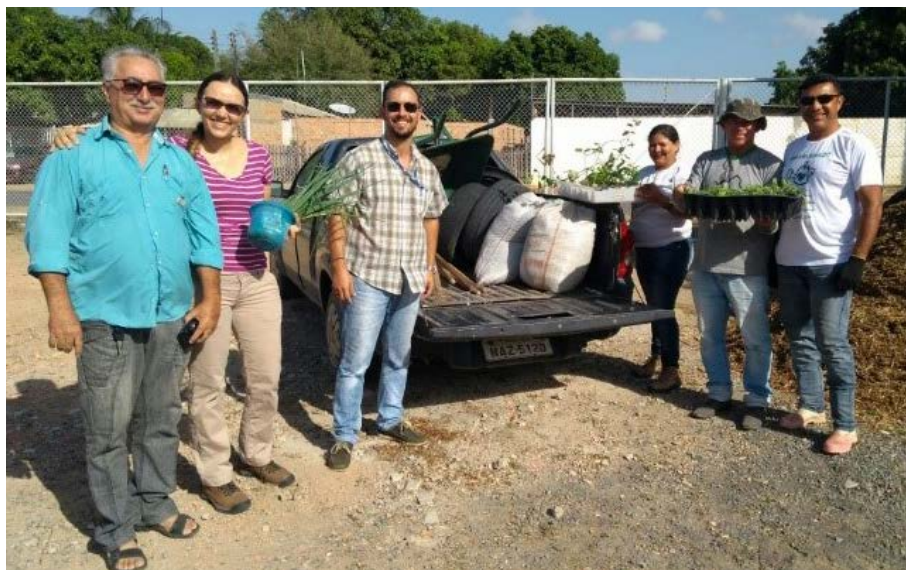
Figura 5.1. Atividade de Instalação do Projeto Quintais Sustentáveis nas residências das famílias participantes, em Boa Vista/RR