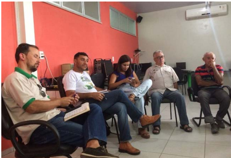
Figura 2.3. Reunião entre equipe técnica do Projeto Quintais Sustentáveis no Lar Fabiano de Cristo, em Boa Vista/RR