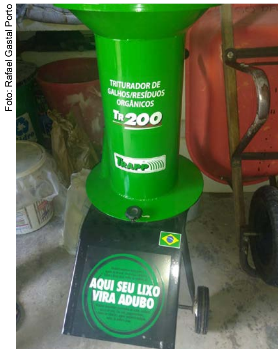
Figura 12.3. Triturador de resíduos orgânicos pelo Projeto Quintais Sustentáveis (Lar Fabiano de Cristo) em Boa Vista/RR

Outra estratégia utilizada pela coordenação do Projeto foi conhecer outras experiências exitosas nas diversas regiões do Brasil, visando o intercâmbio e trocas de conhecimentos e saberes, com base nas realidades locais (Figuras 13.1, 13.2, 13.3, 13.4, 13.5 e 13.6).