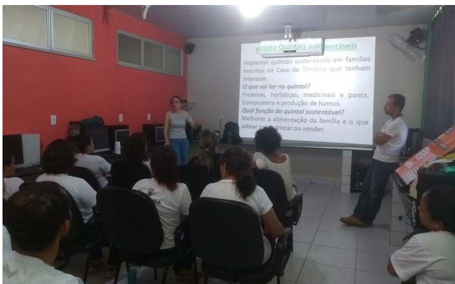
Figura 2.4. Reunião entre equipe técnica do Projeto Quintais Sustentáveis com as merendeiras do Lar Fabiano de Cristo, em Boa Vista/RR