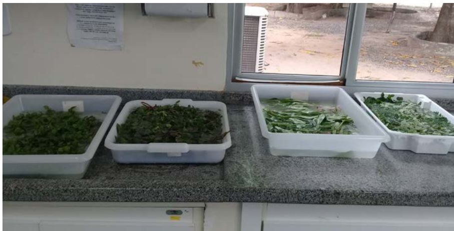
Figura 8.2. Curso de Segurança Alimentar, Nutrição e a Inserção de Hortaliças Não Convencionais na Alimentação pelo III Simpósio de Agroecologia da UERR contemplando o Projeto Quintais Sustentáveis (Embrapa Roraima) em Boa Vista/RR