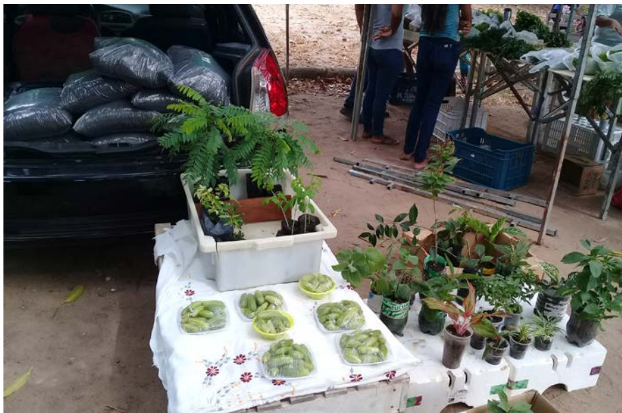
Figura 15.1. Feira Agroecológica da Embrapa Roraima pelo Projeto Quintais Sustentáveis em Boa Vista/RR