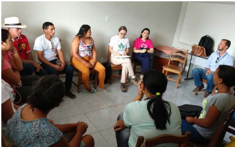
Figura 2.6. Reunião entre equipe técnica do Projeto Quintais Sustentáveis com as famílias no Lar Fabiano de Cristo, em Boa Vista/RR