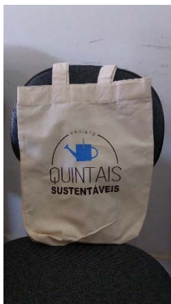
Figura 6.3. Sacola de pano do Projeto Quintais Sustentáveis para as famílias participantes