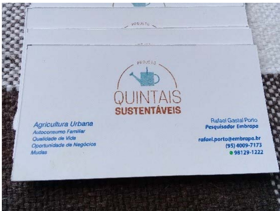
Figura 6.1. Cartão do Projeto Quintais Sustentáveis