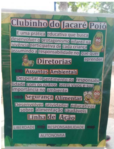
Figura 10.3. Crianças do Lar Fabiano de Cristo mostrando o trabalho de educação ambiental no III Simpósio de Agroecologia da UERR em Boa Vista/RR