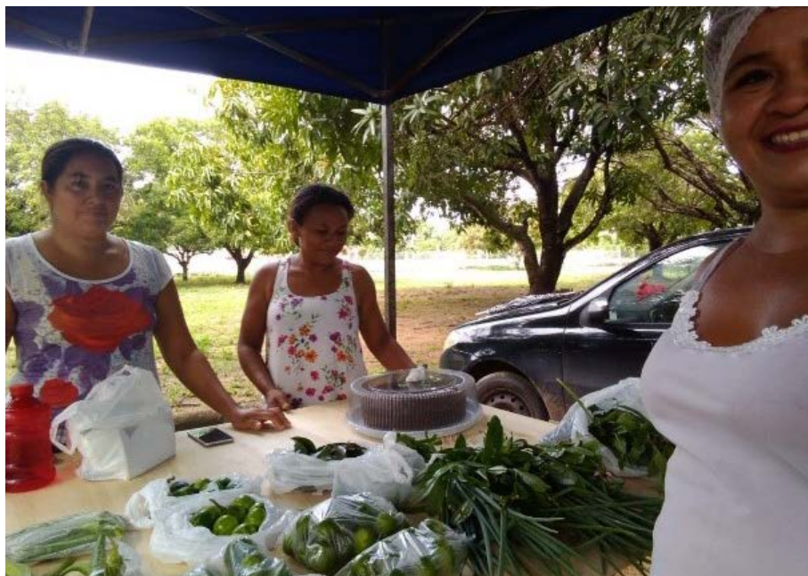
Figura 15.3. Feira Agroecológica da Embrapa Roraima pelo Projeto Quintais Sustentáveis em Boa Vista/RR

No andamento do Projeto e em função do sucesso das Feiras na Embrapa Roraima, recebeu-se diversas demandas de interesse para sua replicação a outros espaços, tais como: Sede do Sindicato do Ministério Público de Roraima, Universidade Estadual de Roraima e 6º BEC (Exército). Apesar de excelentes oportunidades, as decisões cabiam sempre ao grande grupo (equipe e famílias do Projeto), sendo que, chegou-se à conclusão de que ainda que fossem espaços importantes de se participar, o grupo das famílias ainda não estava preparada, naquele momento, em função da escala de produção ser pequena ainda (consumo da própria família e excedente vendido na Embrapa) e o objetivo primordial e a tônica do Projeto desde sua gênese era o de, antes de tudo, atender a questão de segurança alimentar e nutricional das famílias. No entanto, essa oportunidade fica em aberto e, possivelmente, será atendida em um futuro próximo, caso as famílias consigam alçar uma escala maior de produção, assim como, o número de famílias a produzirem. Essa perspectiva caminha na lógica a que se tem assistido de crescimento e demanda por alimentos orgânicos, com isso, gerando economia e desenvolvimento local.