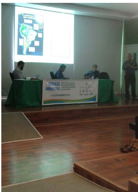
Figura 13.5. Participação no Workshop Serviços Ambientais 2018 na UFAM em Manaus/AM