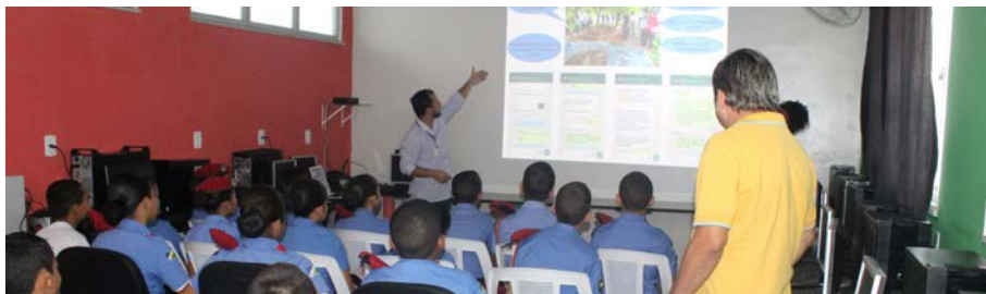
Figura 7.1. Visita de escola por meio do Embrapa & Escola para conhecer os Projetos Educar e Quintais Sustentáveis (Lar Fabiano de Cristo) em Boa Vista/RR