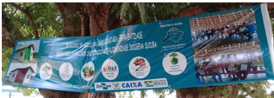
Figura 14.1. Comunidade Indígena do Sucuba, Alto Alegre/RR, Embrapa parceira na oferta de Minicurso para a Comunidade pelo Projeto Quintais Sustentáveis em 2019