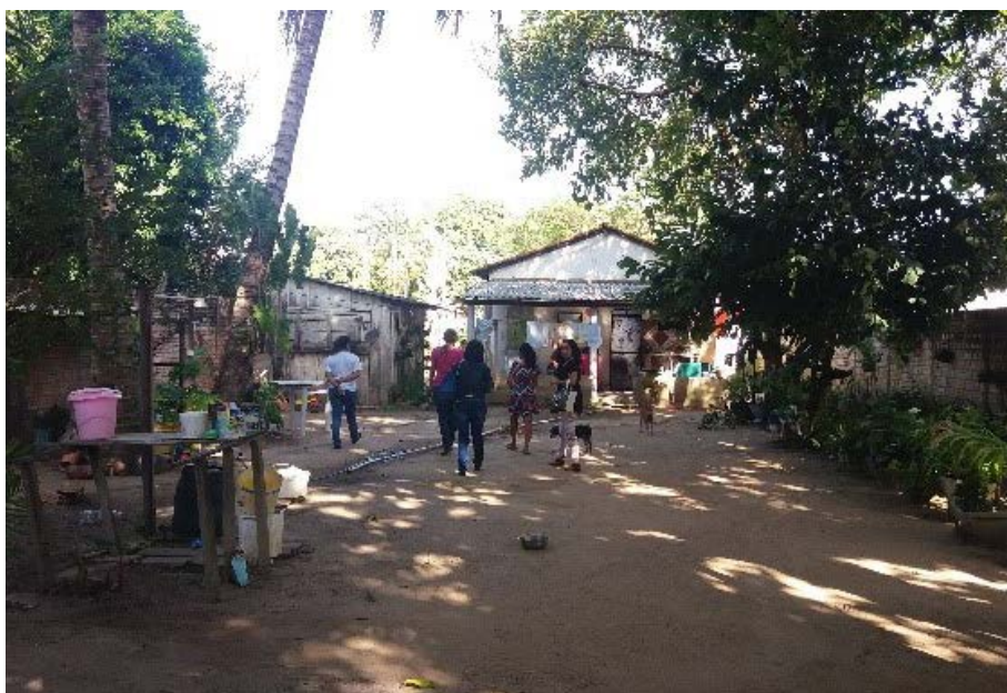
Figura 3.2. Visitas às famílias participantes do Projeto Quintais Sustentáveis com o objetivo de planejar a instalação das hortas, em Boa Vista/RR