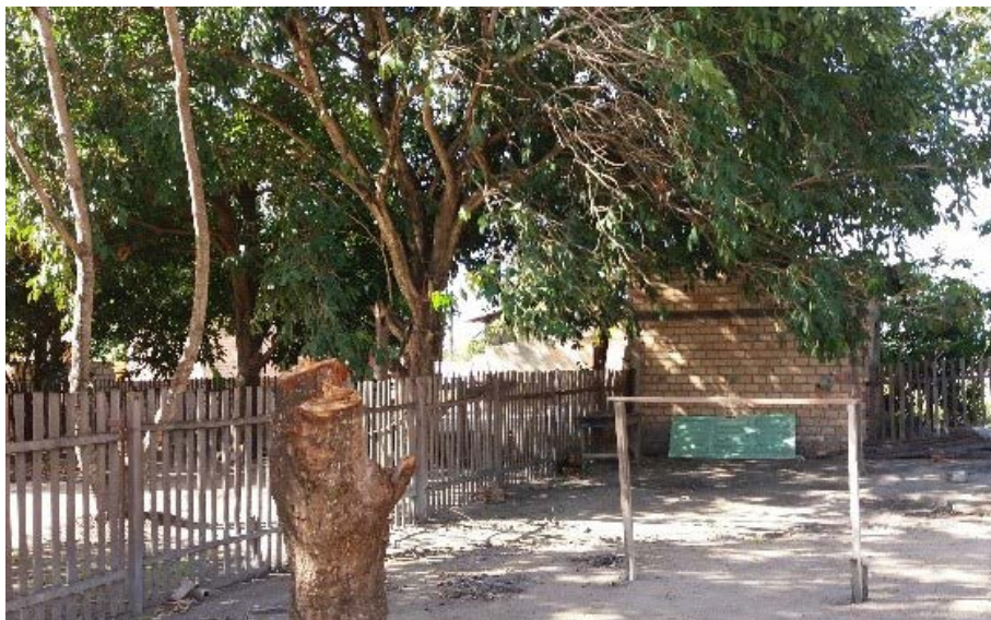
Figura 3.3. Visitas às famílias participantes do Projeto Quintais Sustentáveis com o objetivo de planejar a instalação das hortas, em Boa Vista/RR