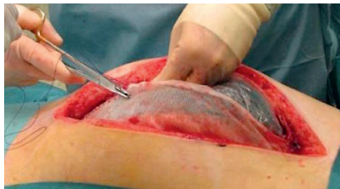
KUVA 3. Avomahan verkkoavusteinen alipainesidos.

Vammahallintakirurgiaan kuuluvaa avomahahoitoa on käytetty myös vatsakalvotulehduspotilailla (26). Avomahahoidon aiheita ovat vatsaontelon ylipaineoireyhtymä sekä kyvyttömyys sulkea vatsaontelo turvotuksen tai kudospuutoksen vuoksi. Jotkut pitävät sen aiheena myös vaikeasti kontaminoitunutta vatsaonteloa. Avomaha on epäfysiologinen ti-