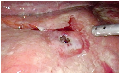
KUVA 2. Laparoskopiakuva puhjenneesta mahahaavasta.

Kriittisesti sairaan potilaan kirurgia tehdään yleisimmin avoleikkauksena keskiviillosta (KUVA 1). Puhjenneen elimen reikä ommellaan tai elin tai sen osa poistetaan ja joskus reikäkohta nostetaan avanteeksi. Lisäksi tulehduserite poistetaan vatsaontelosta, kuolioon mennyt kudos poistetaan, maha-suolikavan toiminta palautetaan elinpoiston jälkeen, vatsaontelo huuhdellaan ja yleensä sinne asetetaan laskuputki vatsanpeitteiden läpi kanavoiden (12).