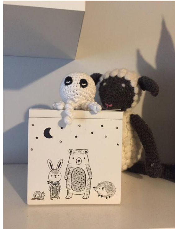
Kuva 7. Ellan muistoesineet.