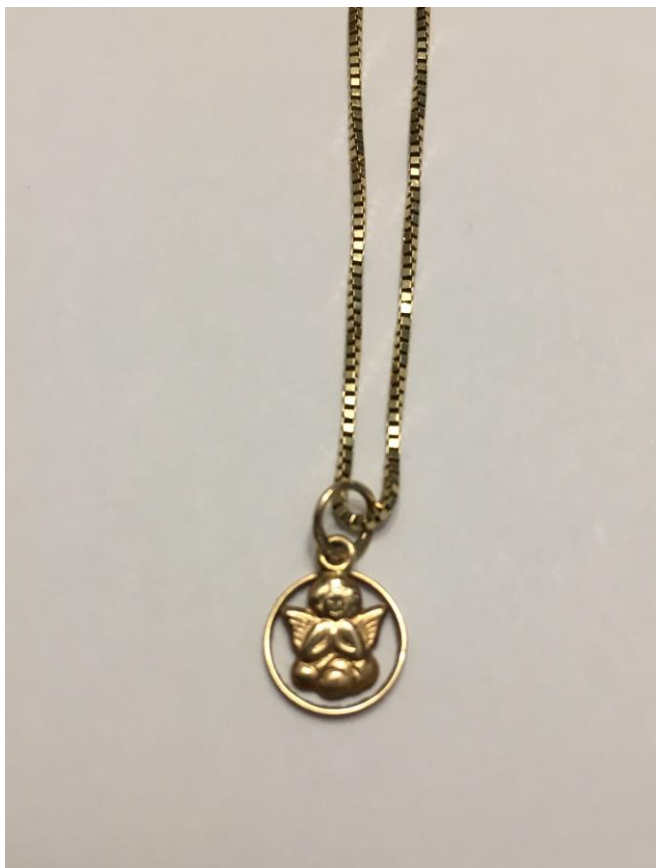
Kuva 12. Meerin muistoesine.