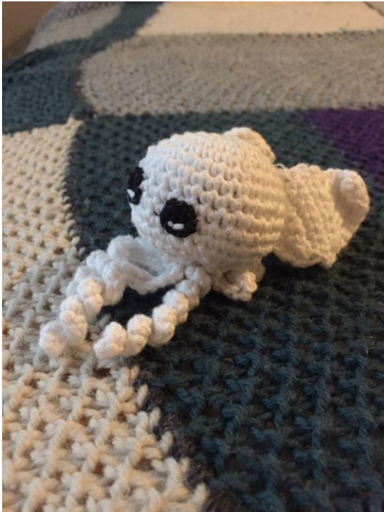
Kuva 6. Ellan muistoesine.