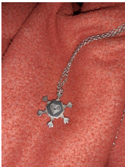
Kuva 3. Elisan 1. muistoesine edestä.