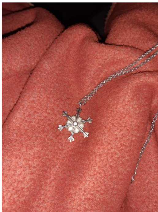
Kuva 4. Elisan 1. muistoesine takaa.