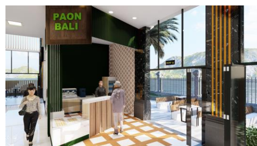
Gambar 8. Perspektif Cafeteria

Desain ruang cafeteria di gambarkan dalam kegiatan acara ngusaba uma , seperti desain lantai yang berbentuk bujur sangkar yang menggambarkan petak sawah petani dan warna coklat dari lantai menggambarkan tanah dari petani. Desain dinding menggunakan warna hijau yang menjadi simbol padi petani yang baru ditanam serta desain dinding yang dilapisi kayu warna hijau di susun vertikal yang menggambarkan posisi dangsil pada saat dinaikkan.