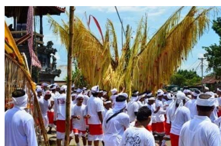
Gambar 1. Tradisi Ngusaba Bukakak di desa Giri Mas

Relevansi antara konsep dengan kasus ialah terminal penumpang pelabuhan laut Celukan Bawang sebagai gerbang pintu masuk ke Bali dari utara atau daerah Buleleng harus menampilkan ciri khas daerah Buleleng, maka salah satu ciri khas daerah Buleleng dari segi tradisinya ialah tradisi Ngusaba Bukakak yang ada di desa Giri Mas. Jika diterjemahkan secara spesifik konsep Ngusaba Bukakak mempunyai fungsi keamanan dan kenyamanan yang mewakili tujuan dari terminal penumpang pelabuhan laut Celukan Bawang.