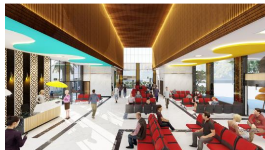
Gambar 4. Perspektif ruang tunggu

Penerapan konsep Bukakak juga di aplikasikan pada sistem lighting interior terminal, hal ini diterapkan pada sistem pencahayaan buatan di plafon yang menggunakan aksent lighting dengan warna kuning pada rongga-rongga susunan kayu, sebagai simbol warna dari penyungsurung . Desain plafon pada ruang tunggu dan ruang informasi menerapkan garis gelombang yang simbol dari semangat dari masyarakat Giri Mas dalam melaksanakan tradisi bukakak . Pemilihan warna pada furnitur seperti kursi tunggu menerapkan warna merah simbol dari kehangatan tujuannya agar penumpang nyaman selama menunggu kedatangan dan keberangkatan kapal.