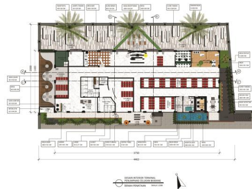
Gambar 3. Denah Penataan

Konsep tradisi Ngusaba Bukakak di terapkan pada penataan kursi tunggu berjejer seperti garis vertikal yang memberikan simbol keharmonisan serta diberikan warna merah yang melambangkan nuasanya keceriaan dan kehangatan, hal ini bertujuan agar penumpang yang sedang menunggu di ruang tunggu dapat merasakan suasana dari tradisi Bukakak . Beralih pada ruang tunggu di arah barat laut pada denah, pada desain lantai di ruang tunggu tersebut diaplikasikan garis bergelombang yang memberikan kesan semangat dari masyarakat akan tradisi ngusaba Bukakak . Pada penataan kursi di ruang tersebut ditambahkan meja berguna untuk menempatkan barang bawaan sementara dan juga sebagai tempat makan dan minum yang khusus di area tunggu tersebut.