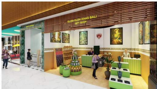
Gambar 5. Perspektif giftshop

memiliki ketinggian 470 cm yang terbuat dari susunan-susunan WPC ( wood plastic Composite ) berukuran 8x4 cm. Susunan WPC disusun secara vertikal yang menjadi simbol susunan dari daun enau pada sarad agung di konsep ngusaba bukakak visi atau tujuannya agar penumpang yang menunggu keberangkatan/kedatangan bisa merasakan suasana keceriaan, kehangatan, dan kebersamaan didalam terminal.