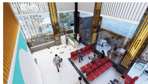
Gambar 7. Perspektif ruang tiketing dan ruang tunggu

menjadi menggambarkan bentuk dari dangsil . Penerapan konsep juga dilihat dari desain ventilasi dibuat tidak tertutup tujuannya agar menyerap penghawaan alami masuk ke dalam ruangan dan begitu juga pada desain jendela terminal yang menggunakan material kaca guna menyerap cahaya matahari langsung masuk ke dalam terminal dengan hal ini untuk di pagi dan siang hari bisa menghemat penggunaan biaya listrik.