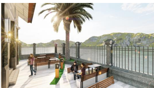
Gambar 6. Perspektif ruang tunggu outdoor

Desain lampu taman yang berwarna hitam dan menggunakan material pasir besi/ melela . Pada desain kursi tunggu outdoor juga menggunakan warna putih simbol dari dewa siwa dalam tradisi ngusaba bukakak . Desain sandaran kursi juga menggunakan material kayu yang dibuat memanjang horizontal yang menggambarkan kedamaian dari tradisi ngusaba bukakak tujuan agar penumpang merasa damai, tenang dan aman selama berada di terminal.