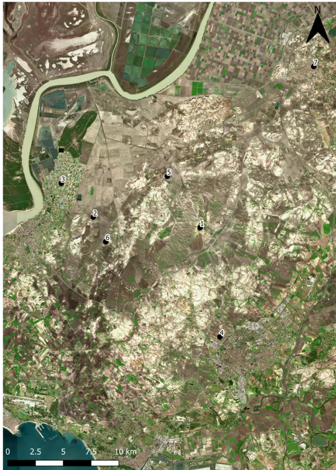
Figura 2. Sector Guadalquivir: 1 Mesas de Asta, 2 Cortijo de Ébora, 3 La Algaida, 4 Cerro de los Villares, 5 Cerro de las Vacas, 6 Cabeza Gorda, 7 Nabrisa (Lebrija).