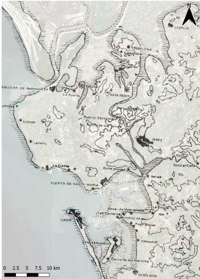
Figura 4. El segundo brazo de la desembocadura del Guadalquivir (Tomado de G. Chic 1979: Gades y la desembocadura..., página 15).

y Arqueología en el nacimiento de ciudades legendarias de la antigüedad . Serie Historia y Geografía, 241. Univ. Sevilla. 2012, 153-197, acompañada de un buen trabajo bibliográfico, pero en este caso considerando la fundación de la ciudad como un mito.