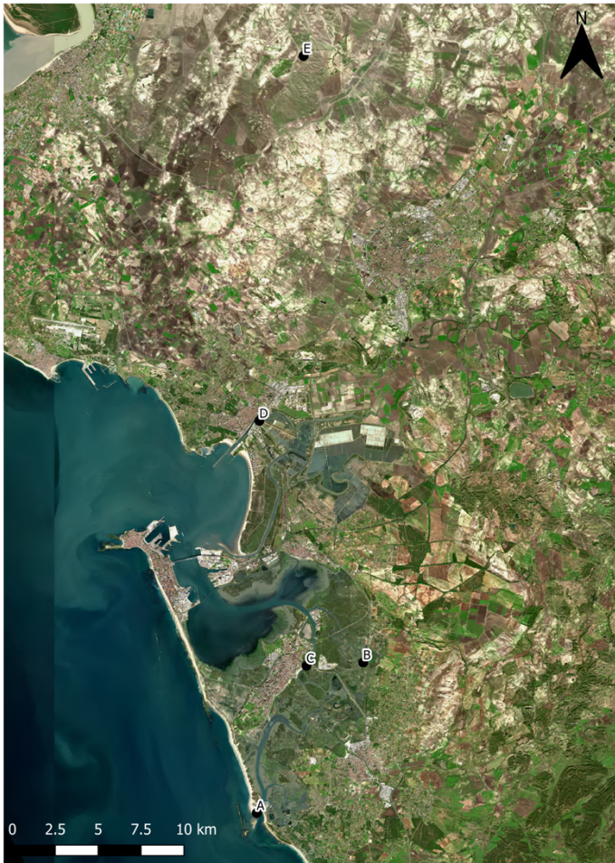
Figura 7. Antropización del paisaje, lugares de intersección entre la comunicación fluvial y la terrestre: A Sancti Petri, B Acueducto, C Ad Pontem, D canal y puente, E Via Augusta.

“Hipótesis sobre la antropización del territorio entre la ...”