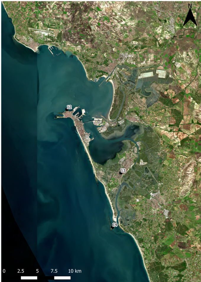
Figura 1. Sector islas: 12 Gadir , 13 Gádeira, 14 Sancti Petri.