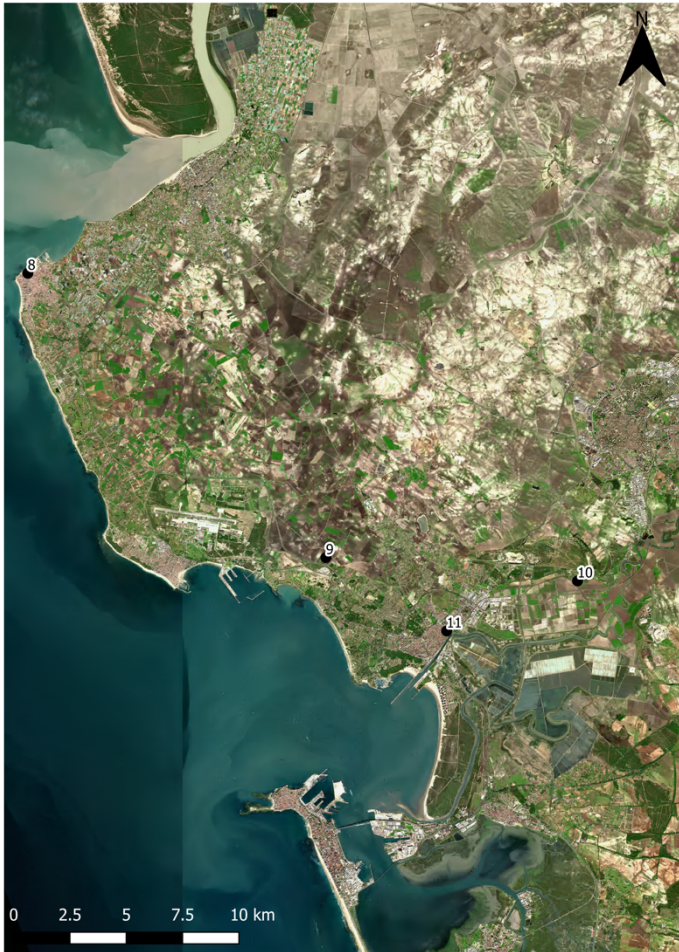
Figura 3. Sector Costa: 8 Caepionis Pyrgos (Chipiona), 9 Oráculo de Menesteo/ Oleastrum Sacrum, 10 Puerto de Menesteo, 11 Puerto Gaditano.

“Hipótesis sobre la antropización del territorio entre la ...”