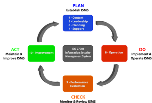
Gambar 2. Model PCDA ISO 27001

Urutan-urutan persyaratan pada standar tersebut tidak mengartikan bahwa