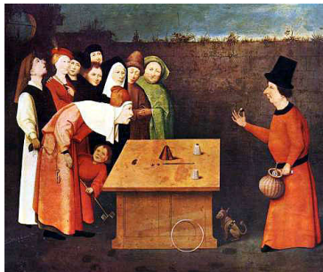
Hieronymus Bosch (1450–1516) »Der Gaukler« 8

Verstecken – durch Zeigen (Chomsky 2002; Bourdieu 1996): verstecken dessen, was sie uns nicht zeigen, etwas anderes zeigen: ein alter Trick, älter als dieses Bild des mittelalterlichen Gauklers: