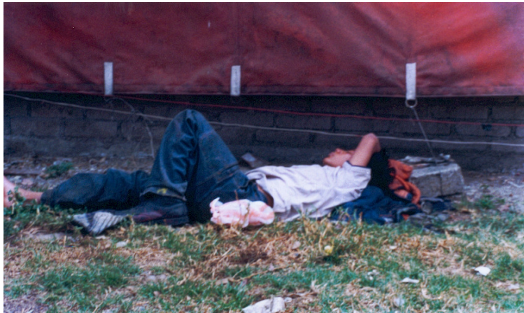
Central de autobuses, Tasqueña.