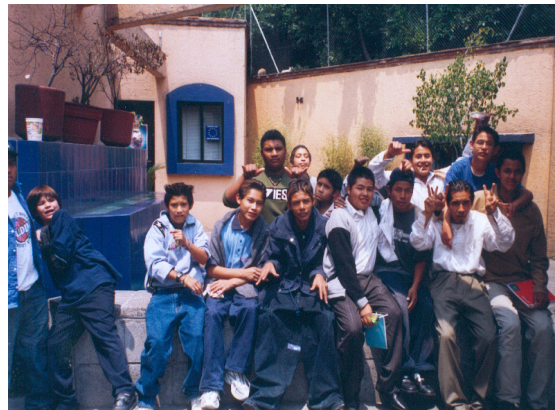
El refugio, Casa Alianza.