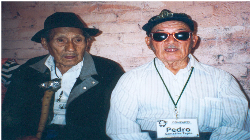
Compañeros de COMPARTE.

Al joven se le aguanta que haga sus locuras porque es joven, bueno que al viejo se le aguante que haga sus locuras como hace el niño y el adulto, ¿no? Entonces esa concepción de una cultura distinta para disfatar lo que es el viejo, estamos trabajando bastante también en eso, esto es importante, y esto es lo que COMPARTE pretende. 49