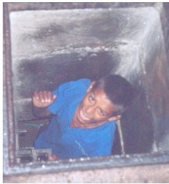
Coladera, Indios Verdes

Una perspectiva positiva que puede tener la religión para el trabajo de las ONG´s, es que muchas de ellas usan la religión como propósito para realizar su trabajo, sea en contra de pobreza en general, para gente de la calle, para niños o ancianos. Hacen trabajos muy buenos que tal vez no harían si no fuera por sus creencias. Ven cómo su obligación trabajar para superar la situación de su prójimo como por ejemplo las vicentinas. Cuando las vicentinas deciden dedicarse a trabajar para los demás, hacen un contrato de dedicarse a ello de por vida.