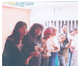
Churinzio, hogar de niñas.