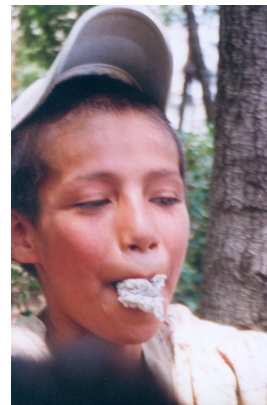
Niño, inhalando, limpia - PVC.