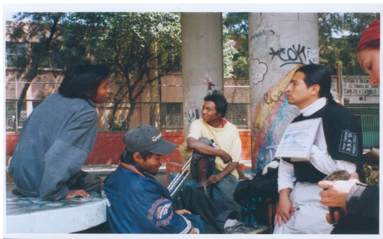
Taller de adicciones, Portales.

La experiencia educativa de las organizaciones sociales que durante más de dos décadas vienen atendiendo a esta población, ha dejado detrás de sí un cúmulo de enseñanzas y reflexiones que al paso del tiempo se convierten en parámetros de referencia para los nuevos proyectos e incluso pueden servirnos de base para bosquejar los lineamientos de una política pública a favor de los y las niñas de la calle. 31