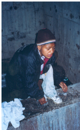
Coladera, Central de Norte

El padre Chinchachoma basa su afirmación en lo que él conoce y sabe a través de los niños y jóvenes de la calle cuando hecha la culpa al machismo, la violación, el abuso de alcohol y de drogas, al fenómeno del niño de la calle.