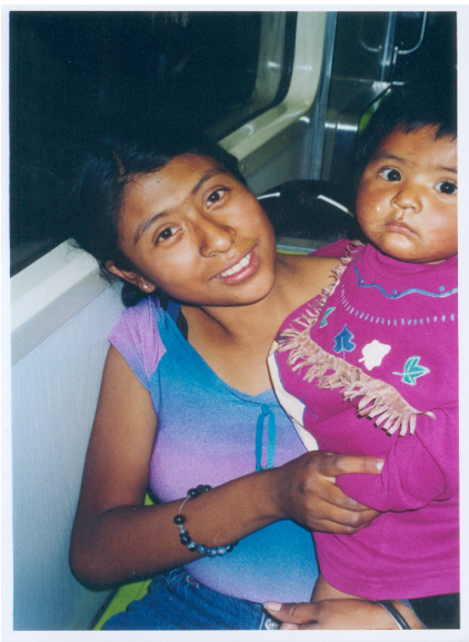
En camino de la coladera de Indios Verdes a CEDAC, con un bebe en los brazos y uno en el vientre.