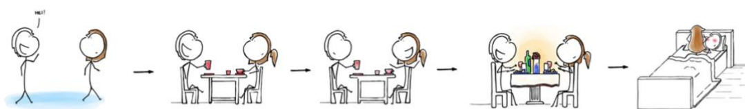
Illustrasjon 1. «The dating timeline in most countries around the world». Hentet fra: Bourelle, Julian S. The Social Guidebook to Norway (2017)