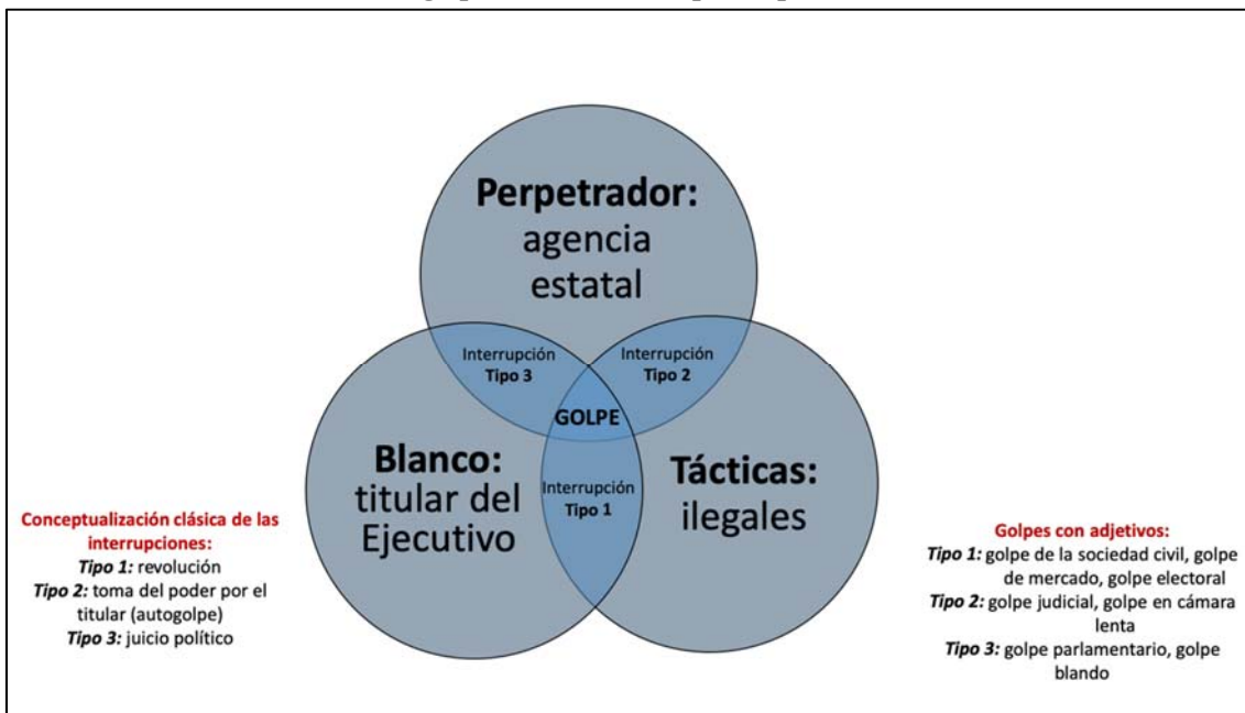
FIGURA 3. Los golpes como un concepto de parecido de familia

Para entender la proliferación de nuevos adjetivos que no satisfacen los tres criterios de golpe, argumentamos que muchos golpes con adjetivos siguen la conceptualización de las interrupciones de mandato con base en la estructura del parecido de familia (Figura 3). Esto implica que hay varios subtipos de golpe, pero no hay condición necesaria o suficiente que sea común a todos. Considerando los elementos constitutivos de perpetrador, blanco y táctica, surgen cuatro combinaciones: