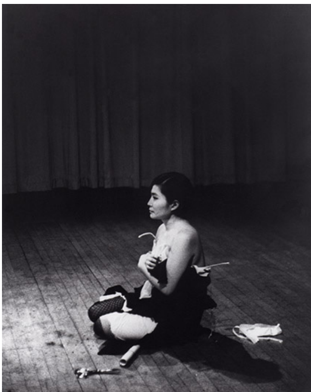
Figura 1: Cut piece , Yoko Ono, 1964. Moma Learning, https://www.moma.org/learn/moma_learning/yoko-ono-cut-piece-1964/