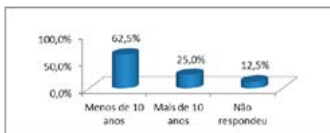
Figura 02: Distribuição etária dos Gestores da PGE/PE

Em relação ao gênero dos gestores, a maioria é do sexo masculino (cinco) e três deles do sexo feminino. No que diz respeito ao tempo de exercício na função de gestão, cinco dos respondentes estão na função a menos de 10 anos, dois a mais de 10 anos e um deles não lembrava o tempo na função. Como era esperado já analisando a formação dos gestores, três deles são mais antigos e não possui formação universitária, o que pode representar uma necessidade de aprimoramento de suas competências gerenciais e sociais para o melhor exercício da função. A Figura 02, a seguir, apresenta a distribuição dos Gestores por faixa etária em percentuais.