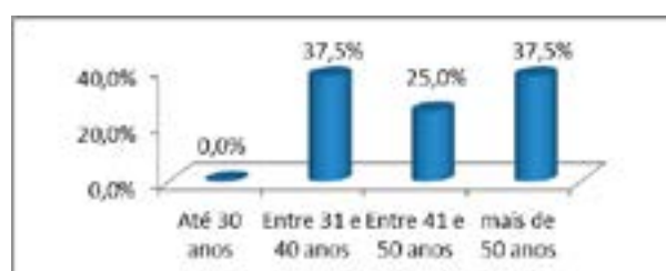
Figura 03: Faixa Etária dos Respondentes

No tangente à idade, observou-se que nenhum dos respondentes possui menos de 30 anos de idade e que a quantidade que possui entre 31 e 40 anos é igual a quantidade que possui mais de 50 anos de idade ou seja, 3 deles possuem mais de 50 anos de idade. Aqui também se confirma o que foi identificado no tocante à formação, pois os mais velhos foram os que não têm nível superior e ainda pode ser preocupante o fato de não se ter gestores mais jovens dentre eles, pois todos estão acima dos 31 anos. Contudo, apesar da faixa etária dos gestores encontrar-se um pouco elevada, isto não acompanha diretamente o tempo de serviço na função de gerência, visto que a maioria dos respondentes está no cargo a menos de 10 anos.