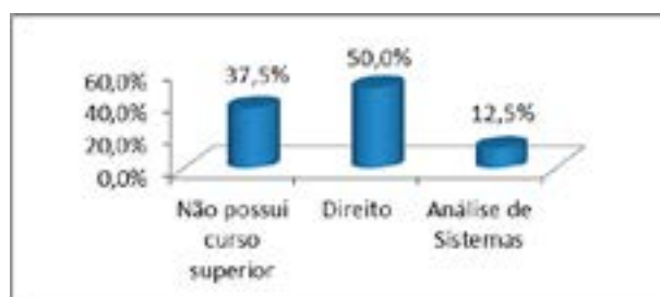
Figura 01: Formação dos respondentes

A primeira questão foi relacionada à formação acadêmica dos gestores entrevistados e a maioria tem formação universitária, sendo metade deles em Direito, ou seja, quatro gestores, um gestor em Análise de Sistemas e três deles respondeu não possuir formação superior. Este dado já mostra uma possibilidade de dificuldades na gestão por esses gestores que não possuem formação superior, uma vez que grande parte dos servidores da PGE/PE possui nível superior e a possibilidade de conflitos de responsabilidade e hierárquicos podem ser mais frequentes. É muito provável que esses gestores que não possuem nível superior sejam os mais antigos na instituição, quando havia uma grande parte dos servidores sem nível universitário.