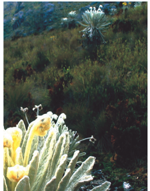
Camino a la "Laguna Colorada"