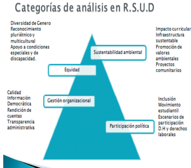
Gráfico 1. Categorías de análisis de la investigación

pectiva ética que debe surgir de la misma. Desde el horizonte de la investigación que motiva este artículo, se establecen como categorías de análisis las siguientes: