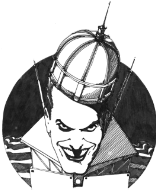
Jocker cúpula. Arq. René Rueda Pilonieta.