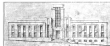
Frontis del palacio de Gobierno de Santander Proyecto de Rafael García Rey y Benjamín García Cadena (Tomado de Revista Santander, 1937, p. 21).

El segundo hecho, parte del fenómeno de crecimiento urbano, que crea la necesidad de consolidar una organización gremial que les permitiera a quienes ejercían el oficio enfrentar la apertura de mercado que se vislumbraba, motivando el origen de la Sociedad Colombiana de Arquitectos. El 6 de junio de 1934, esta institución reunía 9 profesionales: arquitectos, ingenieros y constructores interesados en constituir una agremiación «donde el cambio de ideas fomenta y desarrolla la solidaridad que debe existir entre quienes se dedican a una misma profesión.» 5 Con dos años de diferencia se funda la Facultad de Arquitectura de la Universidad Nacional de Colombia con sede en Bogotá, con lo cual se le dio el estatus de profesión a un oficio, pues hasta la fecha su práctica estuvo en manos de arquitectos extranjeros o nacionales educados en el exterior, lo que implicaba que el país y el Estado reconocían la necesidad de formar profesionales capacitados para resolver los problemas del espacio