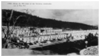
Grupo de casas Urbanización Terrazas, construidas con el plan P-3, 1965.

Detengámonos entonces por un momento en nuestras crisis feas: la vivienda. De acuerdo con el libro Estado ciudad y vivienda 12 , se identifican cinco fases en la «regulación de la acción estatal» en el campo de la vivienda de interés social. La primera tiene su origen en 1918 cuando la Dirección Nacional de Higiene establece las normas para la construcción de viviendas higiénicas para la clase proletaria. A esta fase pertenece la fundación del Banco Central Hipotecario en 1932 y el Instituto de Crédito Territorial en 1936, este último estuvo orientado inicialmente hacia la solución de vivienda rural, hasta 1942 con la creación de la Sección de Vivienda Urbana esta institución no sólo financia planes de vivienda sino que de forma directa construye barrios populares modelos para su venta directa. Esta situación plantea la terminación de la primera fase.