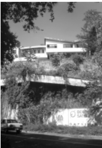
Casa de Próspero Chinchilla.

Un país moderno cuyo foco espacial era la ciudad, con mano de obra calificada para su construcción y dentro de un marco político que no sólo permitía la modernización del país sino que era su objetivo fundamental, hubiese sido una especie de paraíso terrenal para Le Corbusier, Gropius o Mies Van der Rohe y quizás sea la respuesta a los interrogantes que el Arquitecto Pedro Mejía se hace en el prólogo del libro Arquitectura Moderna en Colombia : «Lo que Eduardo Samper denomina Época de oro de la arquitectura colombiana » se refiere a un escaso período de escasos 20 años en los cuales, por confluencia afortunada de diversos factores, un grupo no muy grande de arquitectos, egresados casi todos de la Universidad Nacional, se dispersó por todo el país llevando a todos sus rincones el credo modernista.(...)