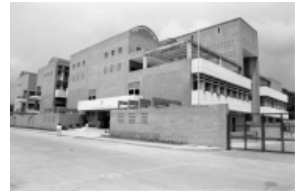
Colegio Nacional de Comercio Diseño Arq. Luis Ardila Cancino

Nos queda una pregunta por contestar ¿Qué pasó con la generación de relevo? En primer lugar debemos partir de que dicha generación terminó su formación con una gran influencia directa o indirecta de Universidades europeas durante el período de posguerra donde la gran discusión disciplinar giraba en torno a la recuperación de los valores históricos en el ámbito arquitectónico y urbano de un continente devastado por la guerra y donde la crisis sobre las promesas de la modernidad eran ampliamente cuestionadas.