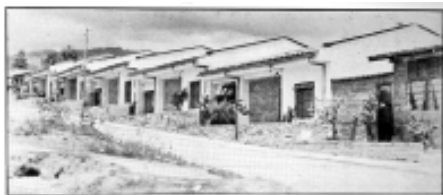
Segunda etapa $ 5.000.00

Finalmente desde 1990 y hasta la fecha surge el período que podríamos denominar como el de la crisis de la industria de la construcción, que consiste en la desviación del sistema UPAC al papel de promotor del desarrollo urbano, esta acción llevó a absorber el patrimonio familiar de los estratos bajos y medios, el valor de los inmuebles era en muchos casos menores a la deuda pendiente, ésta circunstancia produce un estancamiento total de la industria de la construcción en un lapso no mayor de cinco años por ausencia de demanda; así las cosas, los arquitectos convertidos en urbanizadores o en industriales de la construcción se quedaron sin su nuevo patrón y su antiguo patrón está muy ocupado en otros asuntos de todos conocidos como para definir los nuevos rumbos de la arquitectura en Colombia, sin embargo ya está dejando vislumbrar estos nuevos rumbos hacia los cuales la Política Estatal orientará la práctica de la arquitectura en Colombia, pero antes de tratar este tema hagamos una síntesis.