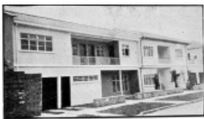
Tercera etapa - $ 11.500

Planes de vivienda popular en Bucaramanga, financiados a través del BCH, ICT. Años 60-70.