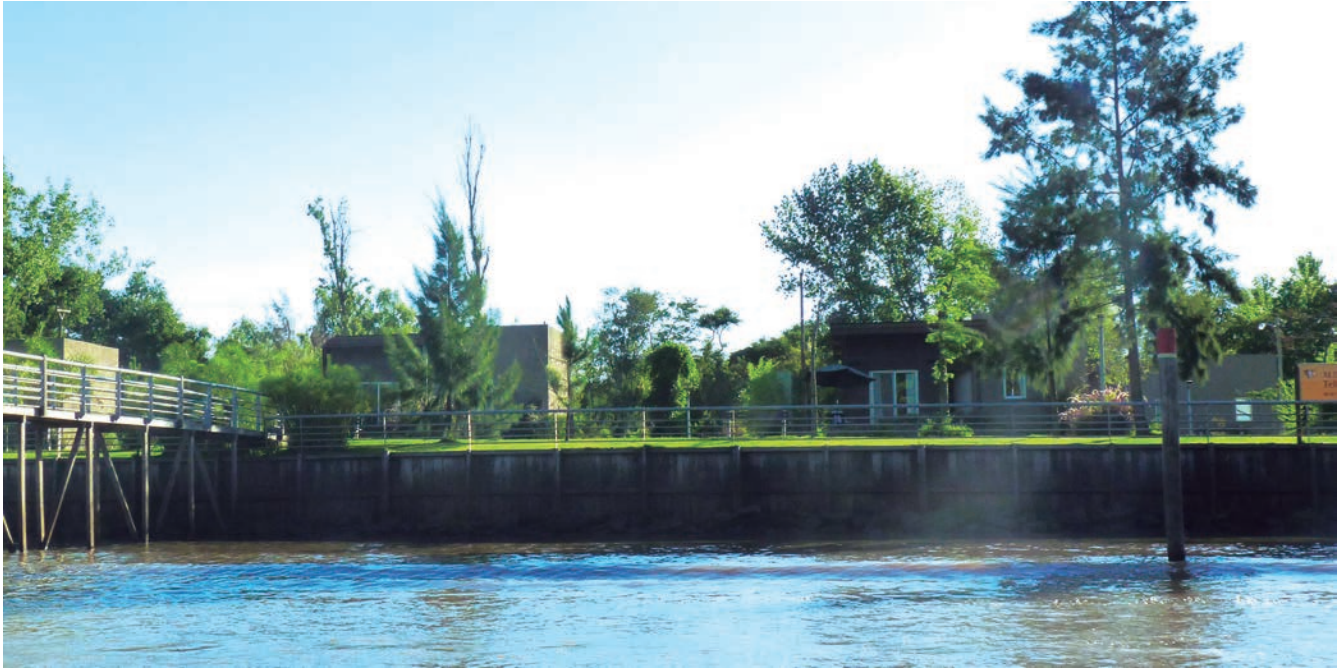
Figura 5. Complejos turísticos de cabañas en las islas

fía y la biodiversidad sino que también generan un movimiento de personas con niveles socioeconómicos y culturales diferentes al característico de la zona. Otro resultado del impacto de las nuevas dinámicas poblacionales, es la situación de contraste que tiene lugar entre la primera y segunda sección de islas, pertenecientes a los municipios de Tigre y San Fernando, respectivamente.