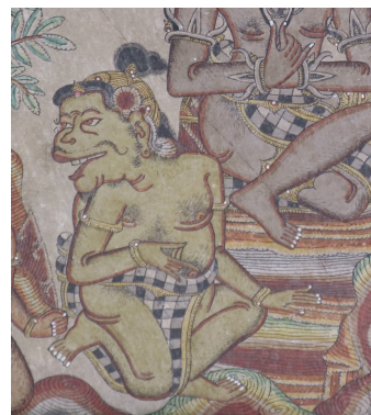
Gambar 2. Figur Tualen pada lukisan Bima swarga di Bale Kertha Gosa

Salah satu tokoh punakawan yang populer dalam pewayangan adalah Tualen atau bagi masyarakat Jawa lebih dikenal sebagai Semar. Bima dalam perjalanan menuju