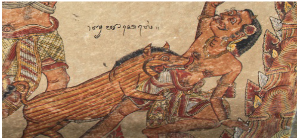
Gambar 3. Figur Bhuta Celeng pada lukisan Atma Prasangsa di Bale Kertha Gosa

mempunyai tugas dengan jenis siksaan yang berbeda. Bhuta Celeng sendiri bertugas menghukum atma yang semasa hidupnya berperilaku buruk dan jahat. Figur Bhuta Celeng digambarkan menyerupai babi seperti pada gambar 3.