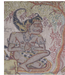
Gambar 1. Figur Bima pada lukisan Bima swarga di Bale Kertha Gosa, Klungkung

Bima adalah salah satu karakter dalam wiracarita Mahabaratha, anak kedua dari lima