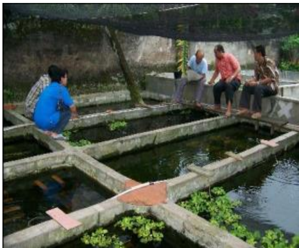
Gambar 4. Penyebaran Bibit Lobster

Pendampingan dapat meningkatkan pemahaman peserta dalam penanganan masalah yang timbul dalam proses budidaya lobster air tawar.