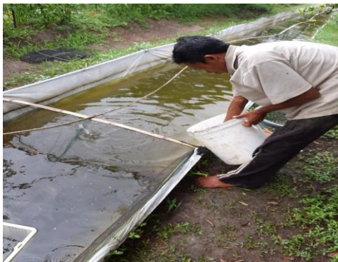
Gambar 1. Kolam Budidaya Ikan Air Tawar

didukung oleh wilayah desa yang dialiri air irigasi dan kondisi wilayah cekungan sehingga untuk kebutuhan penyediaan air sangat mudah (Muhammad Junaidi et al., 2020; Muhammad Junaidi et al., 2021). Perikanan menjadi sektor utama yang menjadi lokomotif perekonomian penduduk dalam mendorong pembangunan di desa ini.