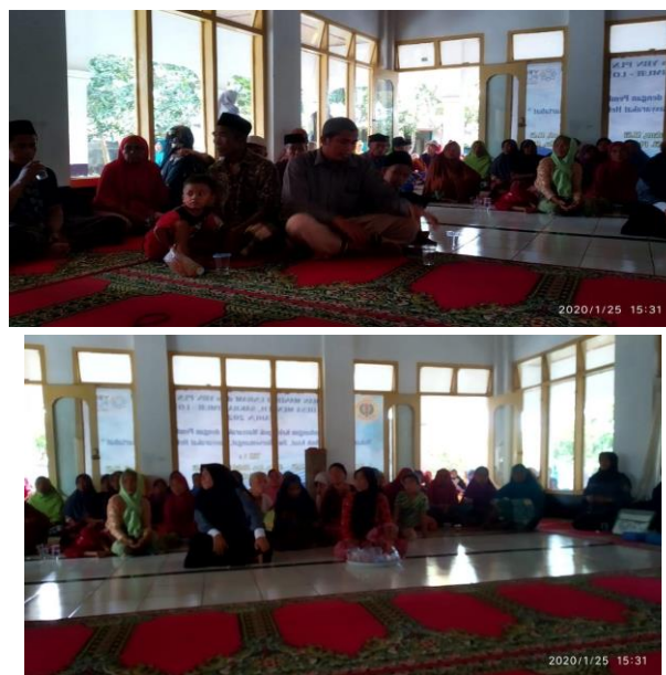
Gambar 2. Kegiatan Sosialisasi, Penjelasan Tim Pengabdian

Penjelasan yang mengedepankan pendekatan kemasyarakatan mengakibatkan pemahaman masyarakat dan aparat desa tentang penguatan kelembagaan masyarakat sangat baik.