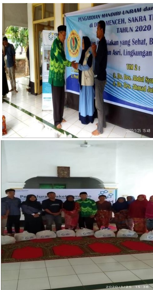
Gambar 3. Pemberian bantuan untuk penguatan kelembagaan masyarakat.

Pemberian bantuan dilakukan untuk merangsang kegiatan kelembagaan masyarakat Desa Menceh menjadi lebih bersemangat dalam menjalankan tugas kelembagaan (Gambar 3).