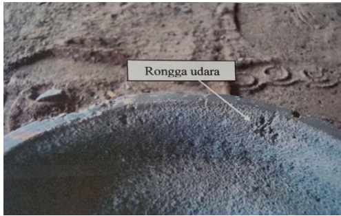
Gambar 3.1 Cacat rongga udara