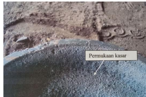
Gambar 3.5 Cacat permukaan kasar