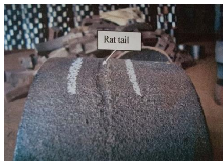
Gambar 3.4 Cacat Rat tail