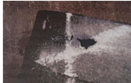
Gambar 3.2 Cacat kurang isi