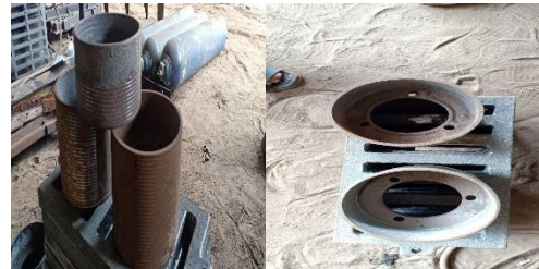
Gambar 2.1 Velg rubber roller