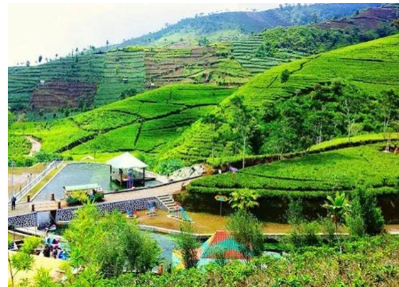
Gambar 1. Kebun Teh Nglinggo

Fasilitas yang ada di Kebun Teh Nglinggo antara lain mushola, toilet, tempat parkir dan warung makanan-minuman ringan. Selain perkebunan teh, di sekitar lokasi ini juga terdapat hutan pinus dan perkebunan warga. Wisata nglinggo masih sangat alami di lokasi juga bisa dilakukan kegiatan petualangan dan perkemahan. Sesuai dengan Undang-undang Nomor 9 tahn 2009 tentang Kepariwisataaan, bahwa keadaan alam, flora, dan fauna, sebagai karunia Tuhan Yang Maha Esa, serta peninggalan purbakala, peninggalan sejarah, seni, dan budaya yang dimiliki bangsa Indonesia merupakan sumber daya dan modal pembangunan kepariwisataan untuk peningkatan kemakmuran dan kesejahteraan rakyat. Tentunya pariwisata mempunyai perbedaan dalam karakteristik khususnya Wisata nglinggo.”