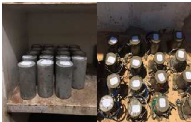
Figura 03: Corpos de prova moldados e em processo de cura em câmara úmida

A figura 3 apresentada a seguir mostra a moldagem dos corpos de prova à direita, bem como sua cura em câmara úmida à esquerda. Para cada traço foram moldados 20 corpos de prova.