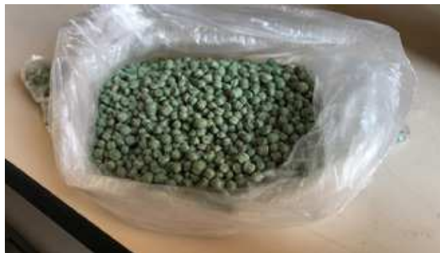
Figura 02 – Pellets de sacolas plásticas

Por esses motivos, é vantajoso buscar um destino para as sacolas plásticas. Para que possa ser utilizado como matéria prima, esse material é moído, triturado e, após isso, comprimido em formato de grãos, recebendo o nome de Pellets, como ilustrado na figura 2 a seguir.