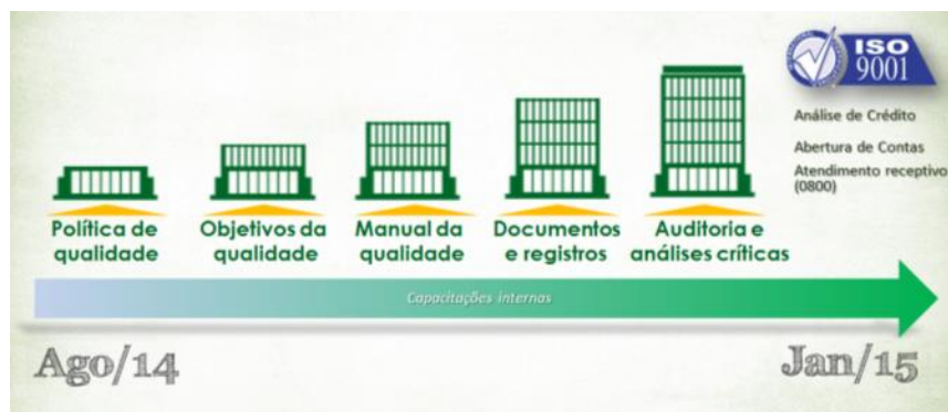
Figura 4: Trajetória ISO 9001 – Sicredi

Resumidamente, a organização estruturou a certificação ISO 9001 em cinco etapas, conforme a Figura 4: definição de política da qualidade, objetivos, elaboração de manual da qualidade, procedimentos documentados e registros e, por último, a validação deste processo com realização de auditorias e análises críticas: