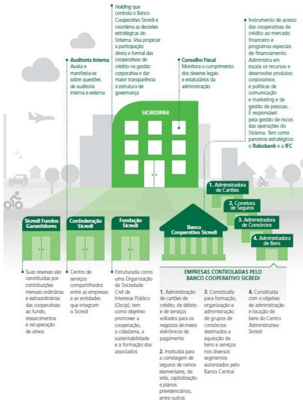
Figura 1: Como funciona o Sicredi.