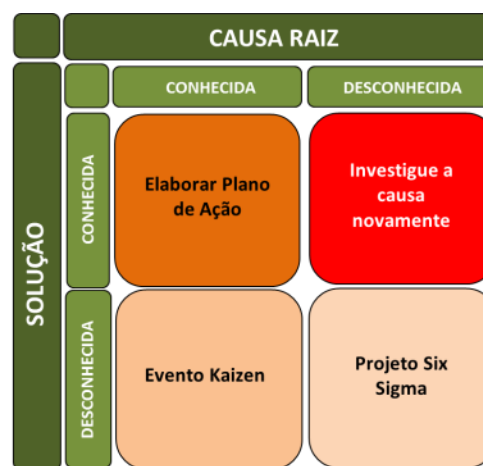
Figura 5: Análise e resolução de problemas

Para isto, participam os colaboradores capacitados em Lean Manufacturing e Six Sigma , conforme esquema da Figura 5.