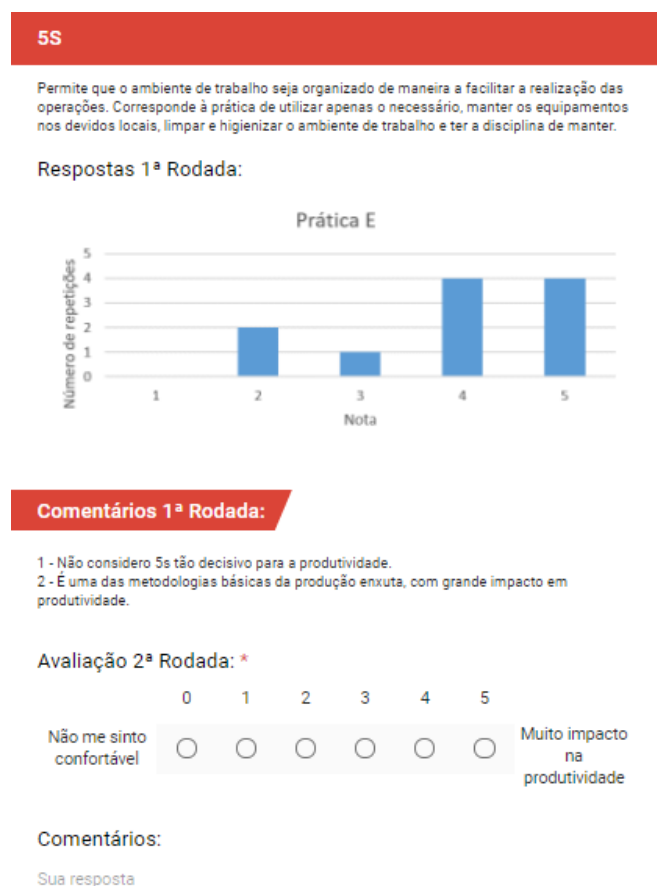
Figura 5 – Exemplo de Avaliação da Segunda Rodada

Dessa forma, analisando os resultados da primeira rodada do modelo, 10 práticas tiveram que ser reavaliadas, além disso, uma nova prática foi proposta por um dos especialistas: “P20 ( Hoshin Kanri )”. Dessa forma, o questionário da segunda rodada foi realizado através de uma plataforma online e enviado para os 11 especialistas participantes da primeira rodada. Um exemplo de avaliação no questionário da segunda rodada pode ser visto na Figura 5. No questionário, além de todas os detalhes que haviam na primeira etapa, foram acrescentados um gráfico com as quantidades de avaliações para cada nível da escala e os comentários feitos pelos especialistas na avaliação anterior, para que os respondentes da segunda etapa pudessem analisar antes de fazer a segunda avaliação. Diante dos 11 especialistas participantes da primeira rodada, na segunda rodada obtivemos 8 respostas, atingindo uma taxa de respostas de 72,72%.