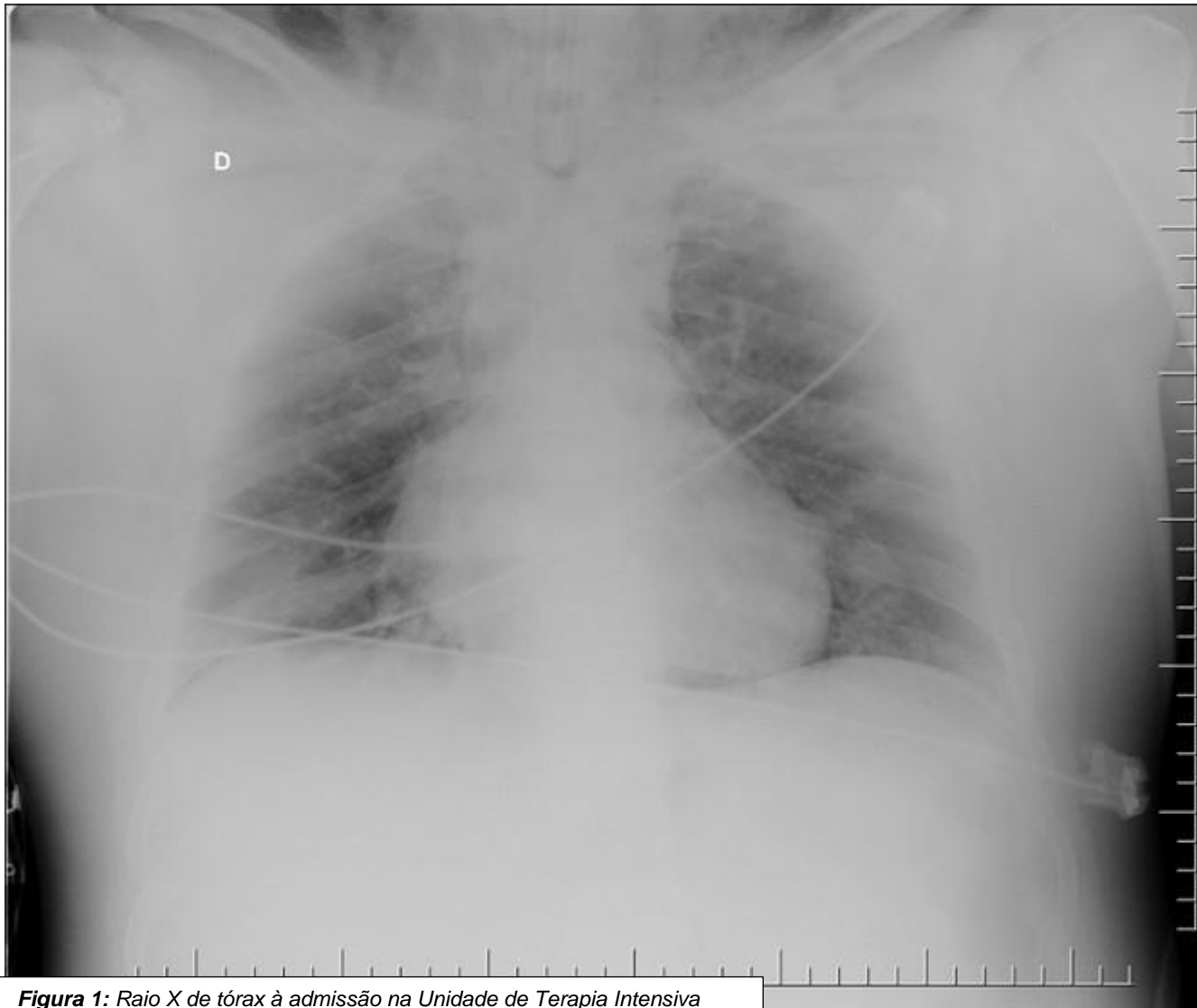
Figura 1: Raio X de tórax à admissão na Unidade de Terapia Intensiva

Roberto Heinisch (médico cardiologista): O coração não é aumentado. O índice cardiotorácico não parece anormal. E os seios costofrênicos são visíveis. Achados que falam contra um edema pulmonar cardiogênico. Importante comentar que se trata de raio-X feito no leito, com a incidência AP (antero-posterior), o que pode influenciar a qualidade da imagem para nossa interpretação. Os pulmões é que parecem reduzidos na imagem, e se vê muita imagem do abdome nesta radiografia.