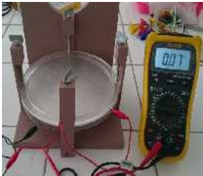
Gambar 3. Percobaan menentukan konstanta dielektrik akrilik [5].

dielektrik akrilik adalah sebagai berikut: