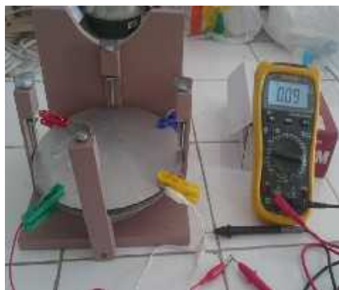
Gambar 4. Percobaan menentukan konstanta dielektrik akrilik.

Langkah percobaan yang dilakukan adalah merangkai seluruh alat seperti pada gambar 2, mengukur kapasitansi untuk bahan dielektrik udara ( d = 5 \text{ mm} ) dan akrilik dengan ketebalan ( d = 1,5 \text{ mm}, 2 \text{ mm}, 4 \text{ mm}, 5 \text{ mm}, 8 \text{ mm}, 10 \text{ mm} ). Untuk percobaan menentukan konstanta dielektrik akrilik adalah sebagai berikut: