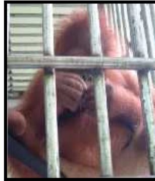
Gambar 4. Perilaku makan serangga anak Orangutan (Jecko) di Stasiun karantina Orangutan Batu Mbelin

sumber pakan dijelaskan Rijksen (1978) sebagai salah satu bentuk belajar orangutan dan menunjukkan bahwa orangutan adalah satwa yang memiliki kecerdasan tinggi.