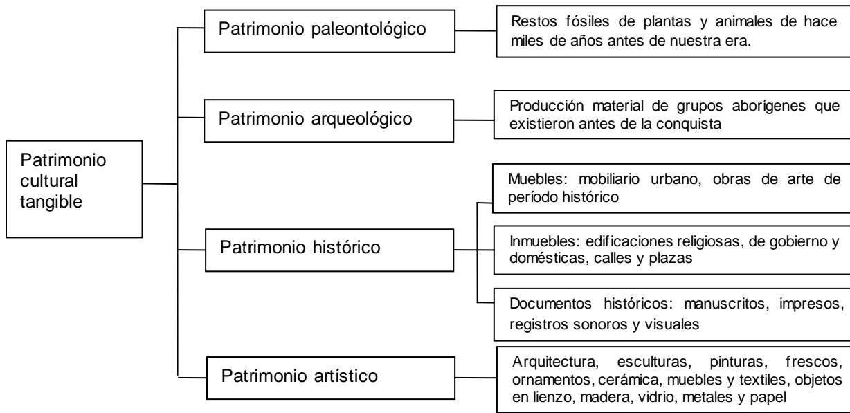
Figura 2. Patrimonio cultural tangible.