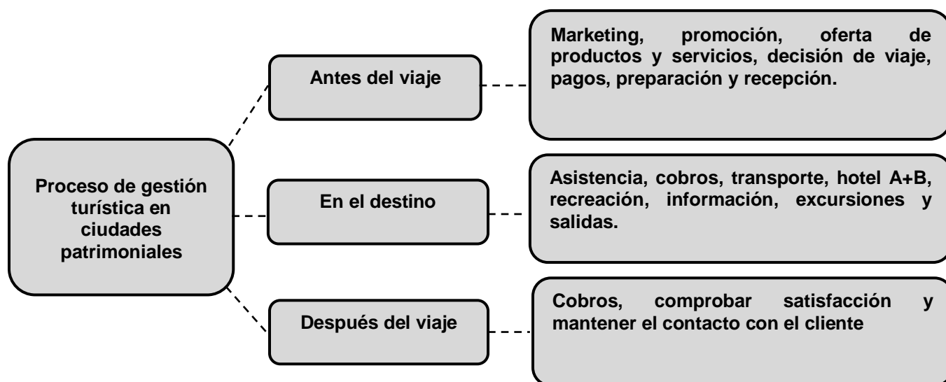
Figura 2. Estructura de las operaciones turísticas en el proceso de gestión turística