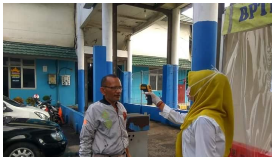
Pengecekan suhu penumpang di terminal rajabasa.

Sosialisasi juga dilakukan oleh Dinas Perhubungan (Dishub) bekerja sama dengan Dinas Kesehatan (Dinkes Kodya) dengan kegiatan rutin yang dilakukan di terminal Rajabasa. Sosialisasi kebersihan dengan selalu mencuci tangan pakai sabun. Setiap Penumpang yang masuk ke Terminal Type A Bandar Lampung, wajib di cek kesehatan.