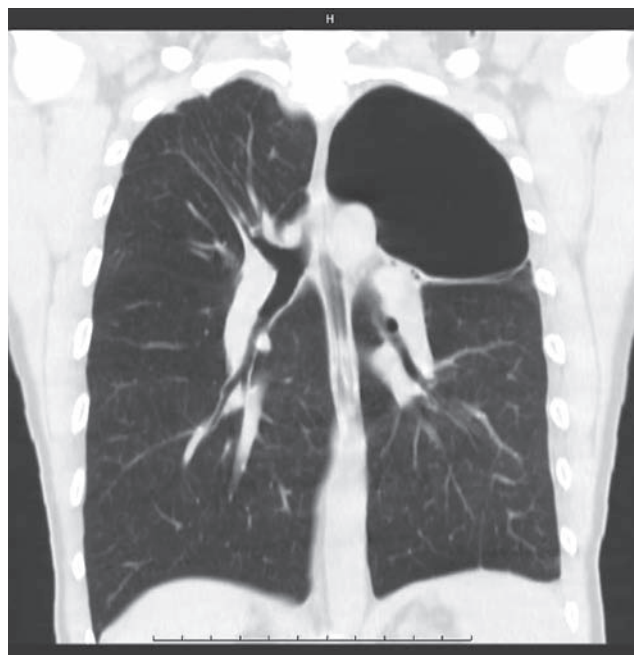
Рис. 2. Компьютерная томограмма грудной полости: гигантская булла левого легкого Figure 2. Chest computer tomography scan: giant bull of the left lung

следующие осложнения ( n = 7 ): продленный сброс воздуха ( n = 5 ), эмпиема плевры ( n = 1 ), полиорганная недостаточность ( n = 1 ). Летальный исход наступил у 1 пациента, поступившего в экстренном порядке, которому на 1-м этапе проведено дренирование гигантской буллы.