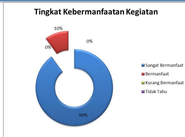
Gambar 3. Tingkat Kebermanfaatan Kegiatan

Berdasarkan hasil penelusuran tim terkait kebermanfaatan kegiatan kepada peserta pelatihan yang berjumlah 20 orang, diperoleh data 18 orang merasa kegiatan ini sangat bermanfaat atau setara dengan 90% jumlah peserta dan 2 orang merasa kegiatan ini bermanfaat atau setara dengan 2%. Hal ini menunjukkan bahwa kegiatan “Pelatihan Penggunaan Aplikasi Edmodo sebagai Sarana Pembelajaran Daring bagi Tenaga Pendidik di SMP N 1 Kefamenanu” telah memberikan manfaat positif bagi peserta dan telah dirasakan kebermanfaatannya.