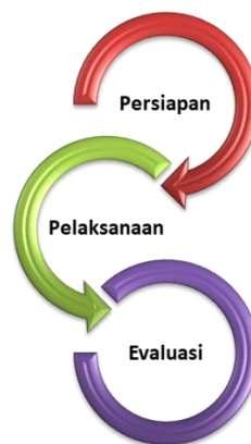
Gambar 3. Alur Pelaksanaan Kegiatan

Secara keseluruhan, bentuk dan alur kegiatan dalam kegiatan pelatihan penggunaan aplikasi edmodo sebagai sarana pembelajaran daring bagi tenaga pendidik di SMP N 1 Kefamenanu tersaji dalam gambar berikut ini.