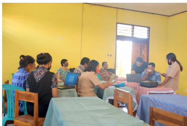
Gambar 2. Diskusi Terbimbing Penggunaan Aplikasi Edmodo

Lebih lanjut skenario kegiatan pengabdian ini mengikuti prosedur sebagai berikut: