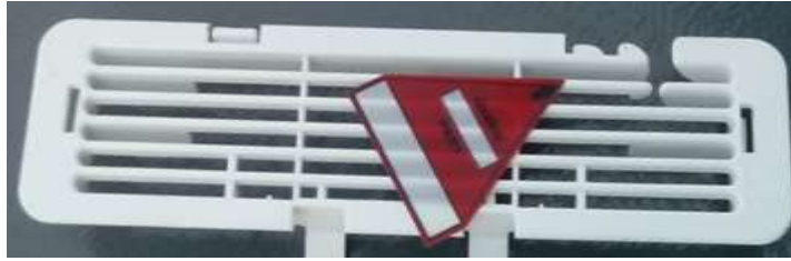
Gambar 4. Hasil Proses Injection pada Cover Air Flow 130°C