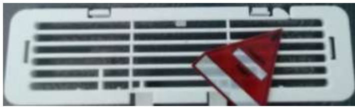
Gambar 5. Hasil Proses Injection pada Cover Air Flow 150°C