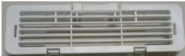
Gambar 6. Hasil Proses Injection pada Cover Air Flow 170°C