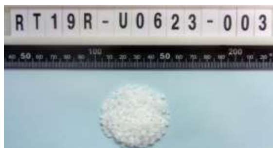
Gambar 3. Resin PP Grade M560