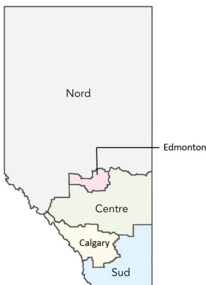
Figure 1 : Carte de la province de l'Alberta montrant les cinq régions sanitaires définies par les services de santé de l'Alberta. Figure générée à l'aide de l'application de cartographie GeoDiscover Alberta.

Le nombre et l'emplacement des optométristes, des ophtalmologistes et des opticiens en exercice en Alberta ont été déterminés à l'aide des données de l'ordre des optométristes de l'Alberta (Alberta College of Optometrists), de l'ordre des médecins et chirurgiens de l'Alberta (College of Physicians and Surgeons of Alberta) et de l'association des opticiens de l'Alberta (Alberta College and Association of Opticians) 4 . D'après les données démographiques de 2018 pour chacune des cinq régions sanitaires, les ratios entre optométristes et ophtalmologistes pour la population de chaque région ont été calculés et comparés aux indices de référence internationaux définis précédemment. L'indice de référence international pour les optométristes est de 1 pour 10 000 personnes comme dans le reste du Canada, aux États-Unis et en Australie 5,6 . L'indice de référence international pour les ophtalmologistes est estimé à 3 pour 100 000 personnes 7 . Les besoins de la population en matière d'examen de réfraction réalisés par des opticiens sont fondés sur la question de savoir si les ratios des optométristes et des ophtalmologistes par rapport à la population dans chaque région sanitaire respectent ces indices de référence internationaux.