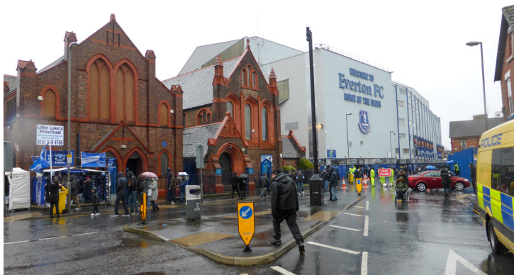
St. Luke's Church i midten med menighedshuset til venstre og stadion til højre. På kampdage serverer ældre damer fra menigheden kaffe og the af rigtige krus fra menighedshuset, og der er salg af gamle programmer m.m. Vinter 2015.

første og største fodboldstadion-arkitekt Archibald Leitch i 1938. Men først senere i eftermiddag skal vi ind og sidde på den, når Everton skal spille kamp mod Burnley. Lige nu er det de mange skilte, der sidder på muren, vi er opmærksomme på. Skilte med navne på Evertons spillere- og tilhængere, der har fået deres aske gravet ned i haven. Samt kirkens præster. Men de hører i sagens natur også til blandt tilhængerne. Kirketjeneren forklarer, at han altid spørger de pårørende, hvor på stadion den afdøde havde sit sæsonkort. Og hvis vedkommende sad på Gwladys Street tribunen, har han placeret skiltet og asken så tæt på den pågældende række som muligt.