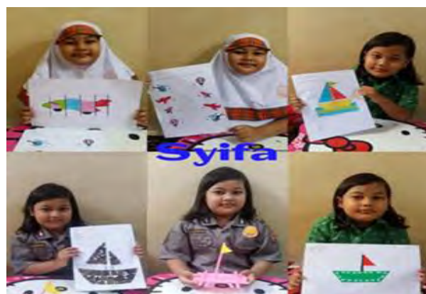
Gambar 1. Anak Menunjukkan Hasil karya Setelah Mengikuti Kegiatan Video Pembelajaran

Tahap akhir merupakan tahap evaluasi. Pada tahap ini dilakukan diskusi atas temuan lapangan yang sudah dibahas pada kegiatan inti sebagai feedback untuk menentukan keberhasilan jalannya proses pembelajaran. Tahapan evaluasi diantaranya melakukan kegiatan pengamatan karya anak. Pengamatan karya anak dalam bentuk portofolio menunjukkan bahwa pemahaman dan kemampuan anak meningkat setelah dilakukan pembelajaran melalui video. Hasil pengamatan selama kegiatan pembelajaran dan wawancara setelah kegiatan pembelajaran dapat diketahui bahwa anak memiliki minat yang tinggi terhadap kegiatan pembelajaran dan memiliki sikap ingin tahu yang tinggi terhadap materi yang disajikan dalam video pembelajaran.