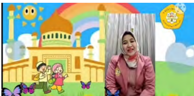
Gambar 4. Contoh Tayangan Video Pembelajaran

Video pembelajaran yang dirancang, dibuat dan diimplementasikan dalam pembelajaran memberikan kesan dan kepuasan tersendiri terhadap orangtua siswa. Diharapkan dengan penggunaan video pembelajaran ini dapat memulihkan semangat dan kepercayaan orangtua siswa tentang pembelajaran di PAUD pada masa pandemi bahwa pembelajaran daring dapat menyajikan kualitas dan kuantitas pengetahuan, sikap dan keterampilan anak walaupun tanpa interaksi tatap muka di kelas.