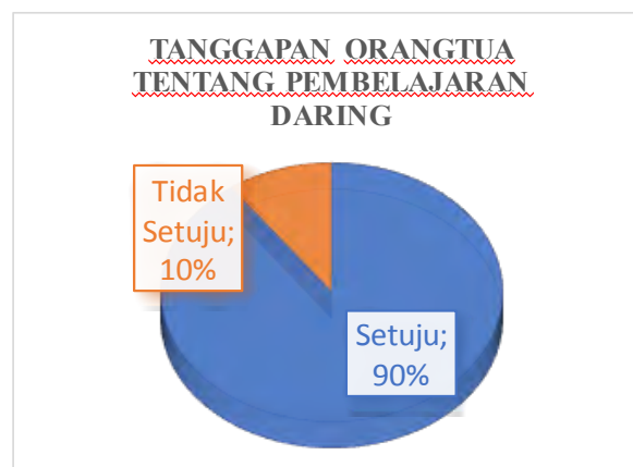
Gambar 2. Tanggapan Orangtua Siswa tentang Pembelajaran Daring

Untuk mengetahui pendapat orangtua tentang pembelajaran menggunakan video pembelajaran dan penyajian konten dalam video pembelajaran maka dilakukan penyebaran angket. Angket yang disebar kepada 20 orangtua siswa menunjukkan bahwa 90% atau 18 orang setuju dengan penggunaan video pembelajaran dan 10% atau 2 orang tidak setuju dengan pembelajaran daring dengan alasan penggunaan video pembelajaran memerlukan kuota. Ditunjukkan dalam diagram sebagai berikut :