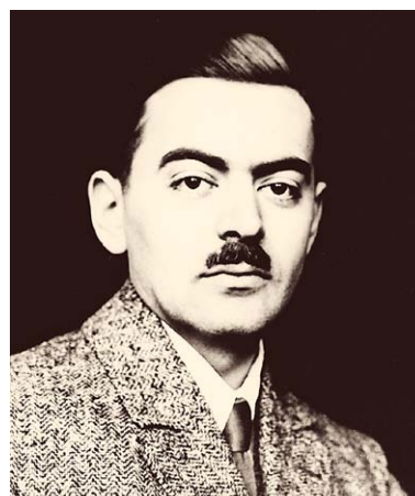
SLIKA 8. / FIGURE 8. ANTE ŠERCER

prvi s područja tadašnje Jugoslavije postao je 1929. članom elitnog društva Collegium Othorinolaryngologicum Amicitiae Sacrum – ORLAS. Godinu dana kasnije postao je članom Jugoslavenske akademije znanosti i umjetnosti, danas HAZU. Bio je dekan Medicinskog fakulteta 1936./37., 1943./44. i 1944./45. godine. Osnovao je Medicinski fakultet u Sarajevu 1944. godine. U publicistici je ostavio neizbrisiv trag. Kapitalno djelo ORL propedeutika zbir je ne samo njegovih zapažanja, nego i svjetski poznatih otorinolaringologa o različitim problemima struke. Šercer je bio svestran kada je riječ o kirurškoj vještini. U rinologiji je našao pristup hipofizi transseptalnim putem koji se upotrebljava i danas. Zapažena su njegova istraživanja o odnosu između uspravnog stava čovjeka i savijanja lubanjske baze. Učinio je fenestraciju kod otoskleroze, čime je Zagrebačka ORL klinika postala četvrta u Europi u kojoj je izvršena ova operacija. 9–11 Izveo je prvu dekortikacijsku plastiku nosa u rinologiji.