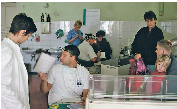
SLIKA 15. AMBULANTA, ŠALATA, 2003. FIGURE 15. THE OUTPATIENT DEPARTMENT, ŠALATA, 2003