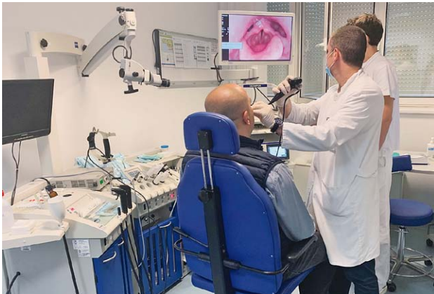
SLIKA 18. AMBULANTA NA KLINICI REBRO, 2021. FIGURE 18. THE OUTPATIENT DEPARTMENT, REBRO, 2021

ma na Rebru. Centar za audiologiju i Centar za fonijatriju preseljavaju sa Šalate 2011. godine u također nove komforne prostore u tzv. zelenoj zgradi na Rebru. Uz navedene prostore, Klinika raspolaže sa stacionarom u tzv. „istočnom češlju“ koji ima 6 bolesničkih postelja smještenih u jednokrevetnim i dvokrevetnim sobama visokog standarda, 4 operacijske dvorane u centralnom operacijskom bloku, jednu operacijsku dvoranu u okviru Jednodnevne kirurgije (Dnevne bolnice) te prostrani prostor Poliklinike sa 6 ambulanti, ambulantom za UZV i operacijskom dvoranom za male kirurške zahvate (slika 18 i 19). Koliko se odluka o preseljenju pokazala ispravnom, potvrdio je nažalost katastrofalni potres u Zagrebu od 22. ožujka 2020. godine, čije su posljedice takva oštećenja na bivšoj zgradi Klinike na Šalati zbog kojih je predviđena za rušenje.