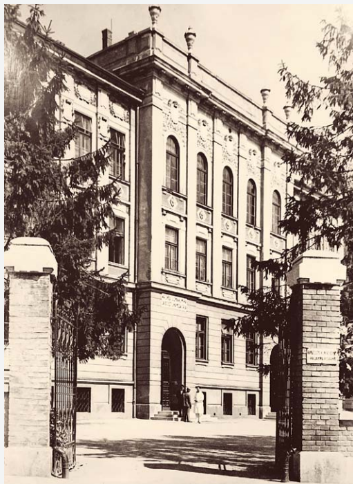
SLIKA 1. ZGRADA KLINIKE U DRAŠKOVIĆEVOJ ULICI, 1921. FIGURE 1. THE DEPARTMENT BUILDING IN DRAŠKOVIĆEVA STREET, 1921