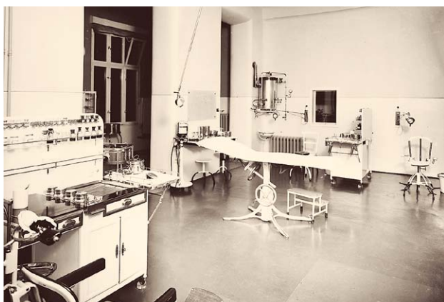
SLIKA 7. PREVIJALIŠTE KLINIKE, 1941.