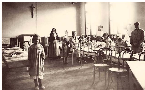
SLIKA 3. BOLESNIČKA SOBA ORL KLINIKE, 1924. FIGURE 3. HOSPITAL ROOM, 1924

Dječje sobe nisu postojale. Tu su bile i ambulanta, fonijatrijski laboratorij, dvije operacijske dvorane, predavaonica koja je ujedno bila i vježbaonica za studente te priručni laboratorij. Na klinici se odvijala i nastava. Svakog semestra redovito su se održavala predavanja iz bolesti uha, grla i nosa (6 sati tjedno) i iz otorinolaringološke propedeutike (2 sata tjedno). Vježbe studenata se obavljaju tri puta tjedno po jedan sat. Značajan trud uložen je u osnivanje kliničke knjižnice i muzeja. Već prve godine nakon osnivanja Klinika je primala 22 inozemna časopisa, a najstarija je knjiga u iznimno vrijednoj knjižnici iz 1684. godine.