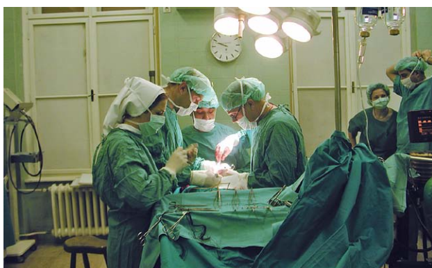
SLIKA 16. OPERACIJSKA DVORANA, ŠALATA, 2005. FIGURE 16. OPERATING ROOM, ŠALATA 2005

log nakon laringektomije i cervikalne ezofagektomije. Prva umjetna pužnica na klinici je implantirana 26. studenog 1996. pod vođenjem profesora Nikole Šprema i docenta Marina Šubarića. Uvedeni su novi postupci u dijagnostici i terapiji: 3D-telekirurgija u ORL, CD govorna audiometrija i endoskopska dakriocistorinostomija u djece. Profesora Simovića je 2003. godine na mjestu predstojnika zamijenio profesor Mislav Gjurić (1958.) nakon iznimne međunarodne karijere i povratka u domovinu, a od 2004. do 2006. godine predstojnik Klinike je bio profesor Damir Gortan (1943.). Sedamdeset godina nakon preseljenja na Šalatu, 2003. godine, kolegij Klinike počeo je razgovore o potrebi obnavljanja opreme i opsežne rekonstrukcije zgrade na Šalati koja svojim stanjem više nije odgovarala organizaciji moderne Klinike, kadrovskim potrebama, adekvatnom smještaju bolesnika i mogućnostima primjene naprednih tehnologija (slike 15 i 16).