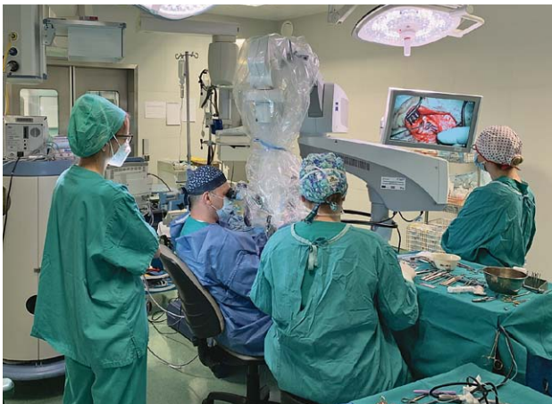
SLIKA 19. OPERACIJSKA DVORANA KLINIKE, REBRO, 2021. FIGURE 19. OPERATING ROOM, REBRO, 2021

Uz sve pogodnosti novog prostora, Klinika kadrovski jača i radi organizacijske promjene. Osnovan je, bolje rečeno, u okviru Klinike vraćen Odjel za maksilofacijalnu kirurgiju, čime Klinika stručno i znanstveno pokriva kompletnu kirurgiju glave i vrata. Formiran je