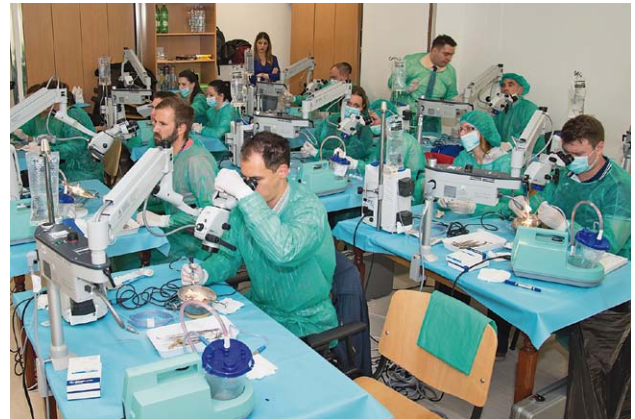
SLIKA 20. TEČAJ IZ ENDOSKOPSKE KIRURGIJE UHA, REBRO, 2018. FIGURE 20. COURSE OF ENDOSCOPIC EAR SURGERY, REBRO, 2018

Klinika je centar za primjenu 3D-navigacijskog sustava za kirurgiju baze lubanje, ultrazvučnog noža, intraoperativnog monitoringa živaca, JET-anestezije, lasera, minimalno invazivnih endoskopskih postupaka na bazi lubanje, grkljanu, sinusima, štitnoj žlijezdi i niza drugih suvremenih procedura. Značajan je broj domaćih i međunarodnih projekata u kojima sudjeluju djelatnici Klinike; mnogi se izvrsni skupovi i tečajevi organiziraju u prostorima Klinike (slika 20). Sve je ovo rezultat rada više od stotine djelatnika Klinike, liječnika i sestara, logopeda, psihologa i fizioterapeuta, službenika i pomoćnog osoblja. Anesteziološku skrb pružaju djelatnici Odjela za anesteziologiju i intenzivno liječenje neuro-