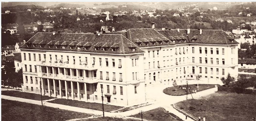
SLIKA 6. – FIGURE 6. ZGRADA KLINIKE NA ŠALATI, 1933. / THE BUILDING AT ŠALATA, 1933.