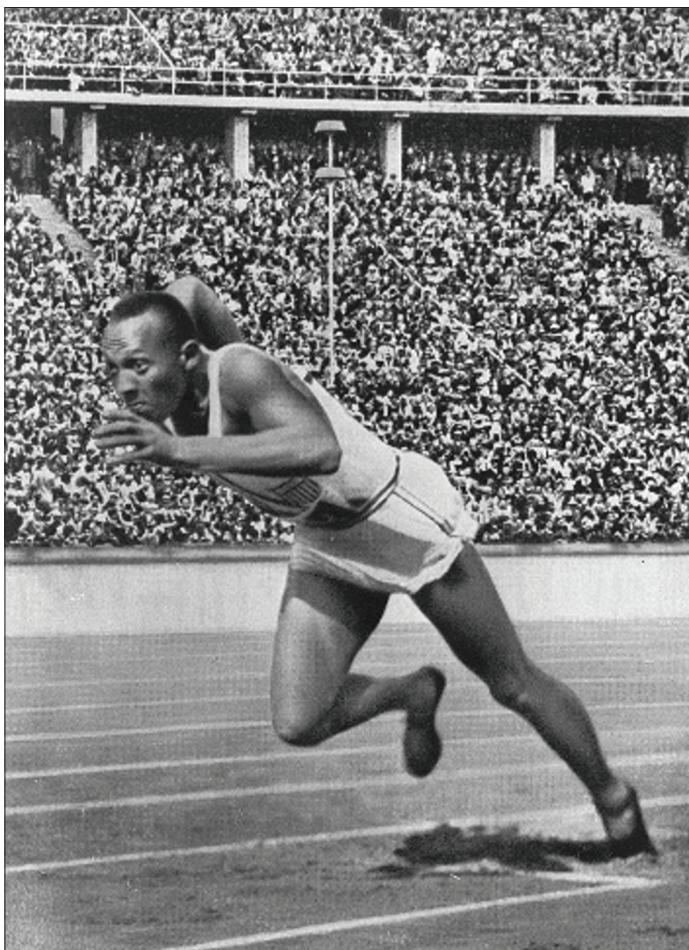
Jesse Owens na Olimpijskim igrama u Berlinu 1936. godine.