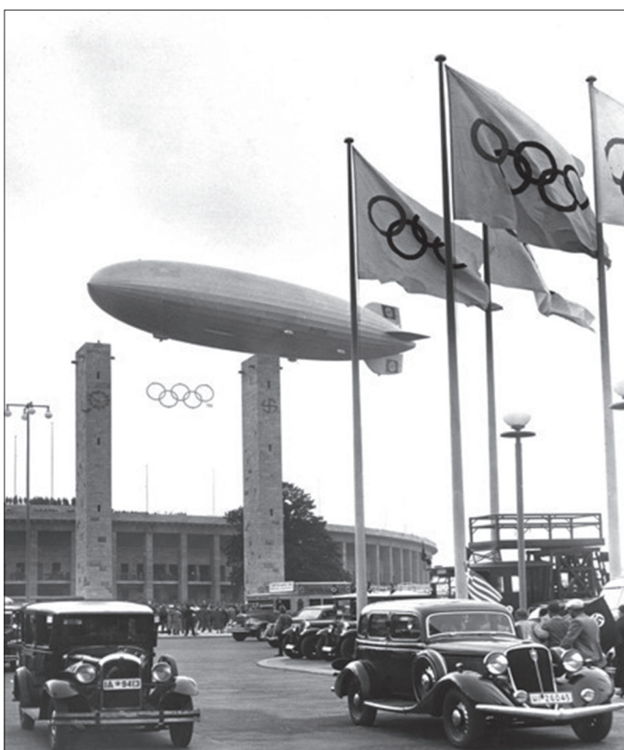
Cepelin Hindenburg iznad olimpijskog stadiona u Berlinu ( https://cdn.historycollection.co/wp-content/uploads/2018/07/The-Hindenburg-floating-over-Berlins-Olympic-Stadium-during-the-1936-Olympics-opening-ceremony..png ).