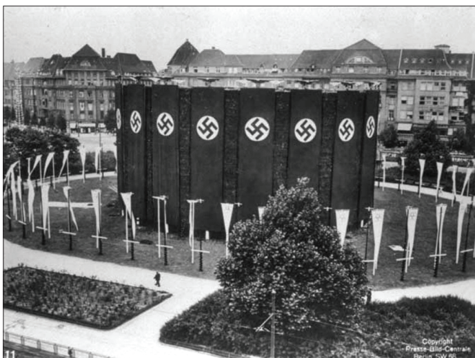
Adolf Hitler Platz tijekom trajanja Olimpijskih igara.