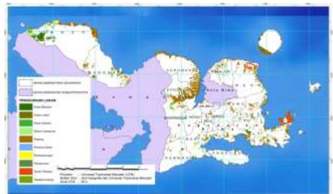
Gambar 3. Peta Sebaran Lahan Kering di Kabupaten Bima

Analisis seluruh kriteria dalam hal ini digunakan 7 tema karakteristik lahan sebagaimana telah dibahas sebelumnya yaitu menentukan kesesuaian lahan aktual untuk tanaman kedelai di Kabupaten Bima menggunakan peta dasar dikhususkan pada lahan kering, sebaran lahan kering mencapai 98,43 % terdiri dari hutan belukar, kebun campuran, padang, perkampungan, tanah terbuka dan tegalan atau ladang. Dibandingkan dengan total keseluruhan lahan di Kabupaten Bima lahan kering sangat mendominasi hampir keseluruhan wilayah.