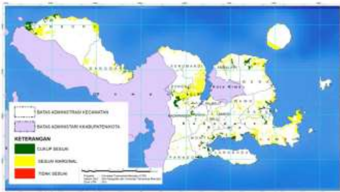
Gambar 4. Peta Kelas Kesesuaian Lahan Kering Aktual di Kabupaten Bima

Hasil analisis terhadap seluruh kriteria tersebut menunjukkan bahwa kelas kesesuaian lahan di daerah penelitian didominasi oleh kelas sesuai marginal (S3). Berdasarkan hasil analisis lahan cukup sesuai (S2) seluas 3.244,20 ha (20%) yang tersebar di 4 kecamatan yaitu Kecamatan Langgudu, Kecamatan Madapangga, Kecamatan Wera dan Kecamatan Tambora, sedangkan sesuai marginal (S3) seluas 28.108,12 ha (78,43%) yang terdiri dari Kecamatan Tambora, Kecamatan Langgudu, Kecamatan Madapangga, Kecamatan lambu, Kecamatan Langgudu, Kecamatan Wera dan tidak sesuai (N) seluas 744 ha (1,45%) di Kecamatan Sape, Kecamatan Monta dan Kecamatan Langgudu. Data kelas kesesuaian lahan untuk tanaman kedelai di Kabupaten Bima dirinci per kecamatan.