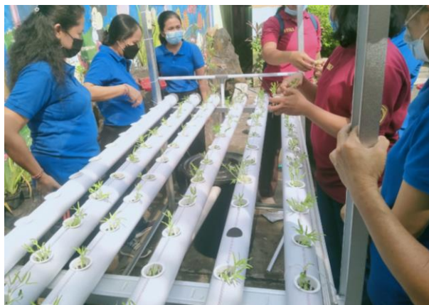
Gambar 4. Guru Melakukan Pindah Tanam

Pada Gambar 3 diatas dapat dilihat bahwa guru melakukan penyemaian bibit tanaman pada rockwall yang telah dipotong-potong sebelumnya. Penyemaian dilakukan sesuai dengan jenis tanaman yang ditanam. Bibit tanaman yang ditanam adalah kangkung, bayam merah dan bayam hijau. Pada proses penyemaian guru sekaligus diperkenalkan model belajar matematika permulaan. Tahap selanjutnya ialah praktek pindah tanam seperti pada Gambar 4 berikut.