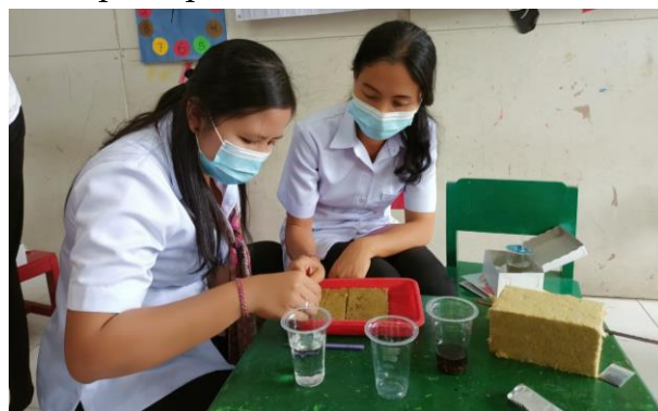
Gambar 3. Penyemaian Bibit Tanaman

Pada bercocok tanam hidroponik, kegiatan diawali dengan pemberian materi terkait dengan cara bercocok tanam hidroponik, kemudian dilanjutkan dengan praktik semai benih sayuran menggunakan media tanam hidroponik. Waktu penyemaian berlangsung selama 1 minggu sehingga pada pelatihan Minggu selanjutnya dilakukan praktik pindah tanam. Praktik pindah tanam merupakan kegiatan pemindahan hasil semaian dari media tanam hidroponik ke instalasi hidroponik. Kegiatan penyemaian bibit ini seperti pada Gambar 3 berikut.