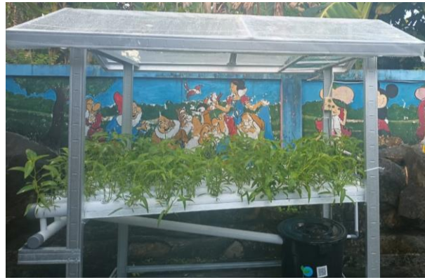
Gambar 2. Instalasi Hidroponik

Gambar 2 merupakan instalasi hidroponik yang digunakan selama kegiatan berlangsung. Instalasi yang diberikan berukuran 2m x 1m x 2,3m dengan model Nutrient Film Technique (NFT) yang merupakan teknik bercocok tanam hidroponik dengan membuat kemiringan pada media tanam sehingga air yang mengalir sangat kecil/tipis. Ini membuat oksigen yang dihasilkan pada media tanam menjadi lebih banyak dan baik untuk tanaman. Namun kelemahan dari metode ini adalah apabila listrik padam maka tidak ada air di dalam pipa. Model ini dipilih karena di TK. Kartika hampir tidak pernah terjadi pemadaman listrik. Instalasi ini memiliki 78 lubang tanam, tandon dengan kapasitas 80 liter, dan dilengkapi dengan atap plastik UV untuk mencegah tanaman terkena air hujan. Hal ini dilakukan karena air hujan dapat mempengaruhi konsentrasi kepekatan nutrisi dalam air. Instalasi juga dilengkapi dengan tempat semai agar benih memperoleh sinar matahari secara penuh.