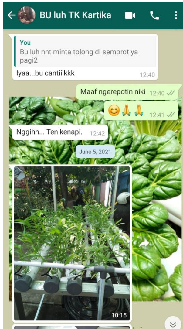
Gambar 6. Screenshot Monitoring Melalui Aplikasi Whastapp

Disamping melakukan kunjungan, monitoring juga dilakukan secara online . Monitoring online ini dilakukan melalui aplikasi Whatsapp seperti pada Gambar 6 berikut.