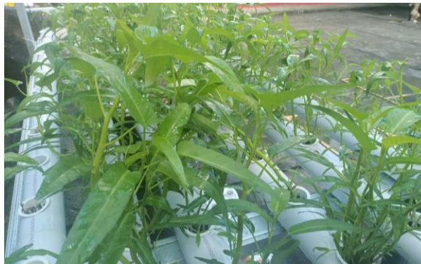
Gambar 5. Tanaman Hidroponik yang Tumbuh dengan Baik

Keberhasilan kegiatan dapat diketahui dengan melakukan kegiatan monitoring dan evaluasi. Kegiatan monitoring dilakukan melalui visitasi atau berkunjung ke lokasi setiap 2 minggu sekali untuk memastikan bahwa tanaman hidroponik dapat tumbuh dengan baik.