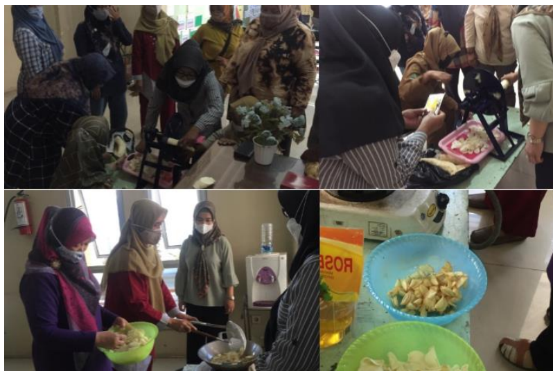
Gambar 5. Praktek Pemotongan Singkong, Praktek Penggorengana dan Keripik Singkong yang Dihasilkan

Berikutnya, para peserta mencoba untuk praktek menggunakan alat tersebut. Di sini dapat dilihat bagaimana antusiasme ibu-ibu PKK dalam mengikuti kegiatan ini. Setiap peserta mengikuti arahan dengan satu tangan mengarahkan singkong dan satu tangan lainnya memutar tuas sehingga singkong tersebut terpotong. Dalam satu putaran tuas, peserta mampu menghasilkan 4 irisan, sehingga 1 singkong yang panjangnya sekitar 15 cm akan membutuhkan waktu sekitar 1 menit pengerjaan. Hal ini cukup membuktikan jika waktu proses pemotongan singkong sangat cepat dibandingkan dengan alat pemotong singkong sederhana lainnya, seperti gambar 1, yang menghabiskan waktu 1,5 menit (Arif dkk., 2013). Selain itu, irisan yang dihasilkan sangat konsisten. Kemudian setelah proses pemotongan, peserta langsung melakukan tahap selanjutnya yaitu penggorengan dan pembumbuan dengan alat dan bahan yang disediakan. Kegiatan praktek ini dapat dilihat pada Gambar 5 berikut.