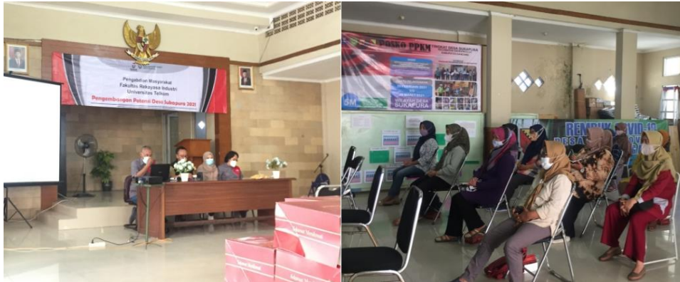
Gambar 3. Pembukaan oleh Sekretaris Desa

Acara dimulai dengan pembukaan dan sambutan dari Sekretaris Desa serta perwakilan dari kampus yang dapat dilihat pada gambar 3 berikut. Sekretaris Desa menyampaikan jika kegiatan ini sangat mendukung keberlangsungan program pemerintah dalam mengembangkan potensi desa yang telah disebutkan sebelumnya.