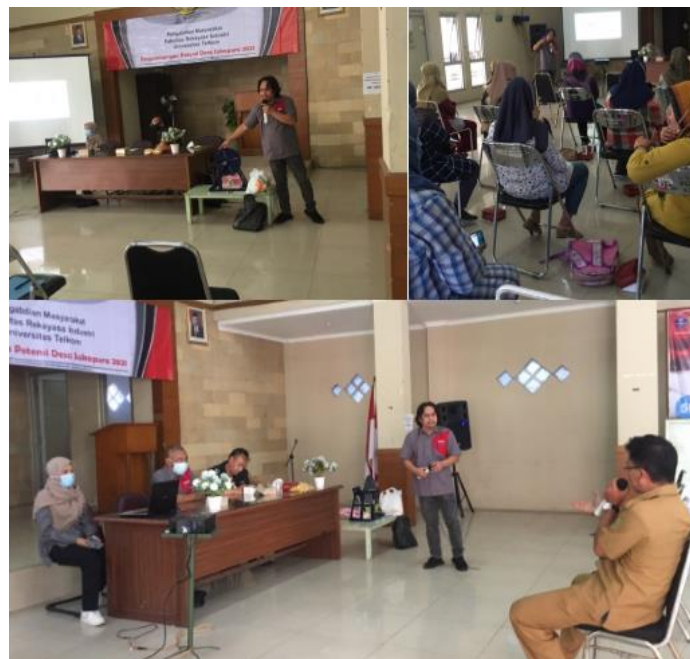
Gambar 4. Demonstrasi, Sesi Tanya Jawab, Penyampaian Materi

Selanjutnya, pemateri memberikan paparan materi terkait apa saja potensi usaha yang dihasilkan oleh singkong, cara produksi keripik singkong, penentuan kualitas singkong, serta penjelasan terkait pemesinan hingga mensosialisasikan bagaimana penggunaan alat pemotong singkong tersebut dan bagaimana alat tersebut dapat meningkatkan produktivitas dan kualitas. Terdapat sesi tanya jawab oleh peserta kepada pemateri, kemudian pemateri melakukan demonstrasi bagaimana alat pemotong singkong tersebut bekerja. Kegiatan-kegiatan inti tersebut dapat dilihat pada Gambar 4 berikut.