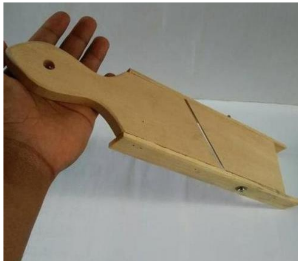
Gambar 1. Alat Pemotong Singkong Paling Sederhana (1)

Untuk alat pemotong singkong sendiri sudah banyak terjual di pasaran, namun beberapa di antaranya masih berupa alat potong paling sederhana serta biasanya dijual dengan harga yang murah seperti pada Gambar 1 berikut.