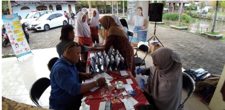
Gambar 3. Pemeriksaan dan Pendataan Golongan Darah

Peserta antusias melakukan pemeriksaan golongan darah, namun, ada beberapa yang tidak melakukan pemeriksaan darah dikarenakan sudah pernah diperiksa dan memiliki kartu golongan darahnya. Pelaksanaan kegiatan ini seperti pada Gambar 3 berikut.