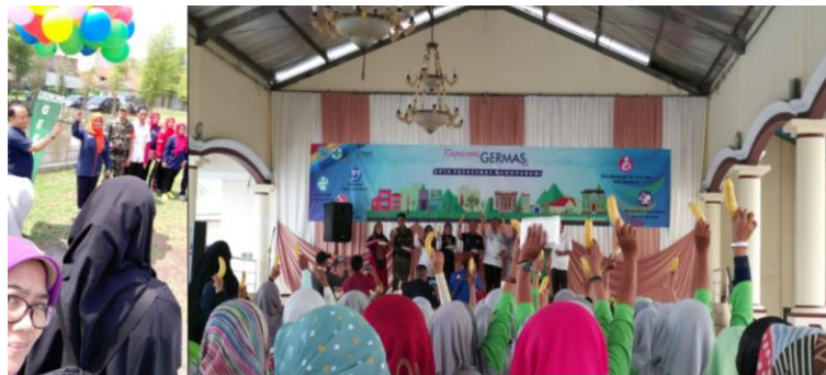
Gambar 1. Sosialisasi Lanching Germas dan Mengkonsumsi Buah-Buahan Bersama

Pembukaan acara sosialisasi Germas dilakukan oleh Kepala Puskesmas, kemudian dilanjutkan dengan acara sosialisasi launching kegiatan Germas, dengan kegiatan pokok Germas adalah makan buah-buahan bersama seperti terlihat pada Gambar 1 berikut.