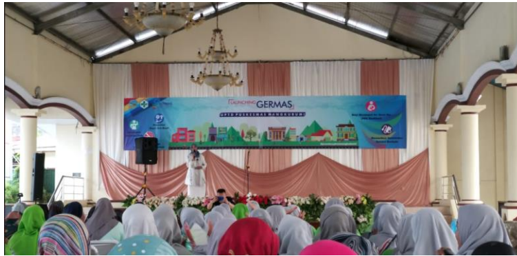
Gambar 2. Sosialisasi

Persiapan alat dan bahannya dijelaskan satu persatu kepada peserta, mulai dari karakteristik kartu golongan darah, yaitu kartu yang memiliki 4 kotak sebagai tempat golongan darah A, B, AB, dan Rh; tusuk gigi sebagai batang pengaduk antara darah dan reagen, tisu untuk membersihkan bagian yang kotor, dan reagen golongan darah yang terdiri dari 3 macam, yaitu Anti-A, Anti-B, dan Anti-AB. Dengan penjelasan bahwa reagen Anti-A berwarna biru, Anti-B berwarna kuning dan Anti-AB tidak berwarna atau bening. Masing-masing warna ini sebagai indikator agar reagen yang dipakai bisa dibedakan dengan jelas dan mencegah penggunaan reagen yang tertukar.