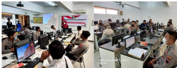
Gambar 3. Suasana PKM di Laboratorium Komputer

Peserta juga diajarkan menyimpan file dengan flashdisk dan menyimpan pada fasilitas google drive. Selain itu peserta juga diberikan ketrampilan untuk mengirim file ke pihak lain melalui email atau whatsapp web sehingga mempermudah pengiriman data dari pihak satu ke pihak yang lain dan memiliki jejak digital. Adapun beberapa foto kegiatan terlihat pada Gambar 2 berikut.