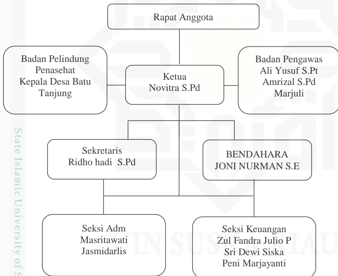
Tabel II.1 Struktur Organisasi Koperasi Simpan Pinjam Anak Luak Tarok Desa Batu Tanjung