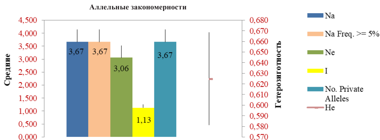
Рис. 1. Оценка аллельных закономерностей у хряков белорусской черно-пестрой породы

Результаты и их обсуждение. В наших исследованиях для микросателлитного анализа хряков белорусской черно-пестрой породы проведено ДНК-тестирование по 9 STR-локусам (SO155, SO355, SO386, SO005, SW72, SW951, SO101, SW240, SW857). Оценка аллельных закономерностей позволяет определить среднее число аллелей (Na), число эффективных (Ne) и «приватных» (Pr) аллелей в расчете на локус, число информативных аллелей или аллелей с частотой встречаемости более 5 %, а также наблюдаемую гетерозиготность (Ho), ожидаемую гетерозиготность (He) и объективно ожидаемую гетерозиготность (uHe). При этом рассчитываются информационный индекс Шеннона (I) и индекс фиксации (F). Результаты оценки аллельных закономерностей основного стада хряков белорусской черно-пестрой породы, разводимых в СГЦ «Заречье», представлены на рис. 1.