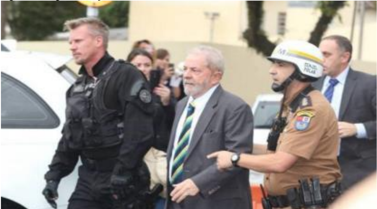
Figura 2 -Imagem da Veja - SP

A fim de que se tenha uma ideia mais clara de como as operações da PF e a cobertura espetacularizada delas tem o poder de distorcer fatos e criar uma imagem extremamente negativa das pessoas, destaca-se a Figura 2, na sequência, a ser detalhada após sua apresentação.