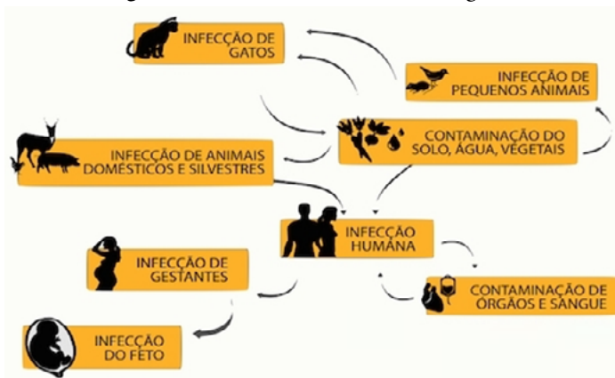
Figura 1 – Ciclo de transmissão do T. gondii