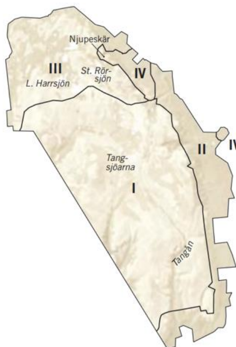
Figur 3: Fulufjällets nationalparks zonindelning. (Fredman, Hörnsten Friberg & Emmelin 2005:21)

Med dessa zoner i åtanke är det intressant att undersöka vad de gör med landskapet när det kommer till brukanderätt och uppfattningen av landskapet. Zonindelningen påstås vara nyckeln till att parken har kunnat bli lokalt förankrad, och innebär en kanalisering av olika intressen i parken. Denna formulering av nationalparken är den första av sitt slag i Sverige, och visar på att nationalparken har behövt moderniseras för att kunna fungera idag. Däremot går det att ifrågasätta om zoneringsen verkligen ger det hybridlandskap som tycks vara på agendan i dagens landskapsdiskurs, eller om det är en förskjutning av kategoriseringen i ytterligare ett led.