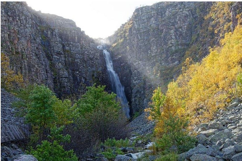
Figur 2: "Fulufjället NP Njupeskar"

Fulufjällets nationalpark är även del av Natura2000 och var en del av PAN Parks nätverk. PAN Parks (Protected Area Network) var en internationell stiftelse som bestod av Vårdsnaturfonden och ett holländskt turistföretag. Stiftelsens mål var att öka intresset för de europeiska nationalparkerna samt värna om naturvärdena, med ett fokus på vildmark. Man menade att ”naturvård och turism skall stärka varandra”. PAN Parks ansökte om konkurs 2014 men fick avslag och ställdes inför likvidation (Rossberg 2014).