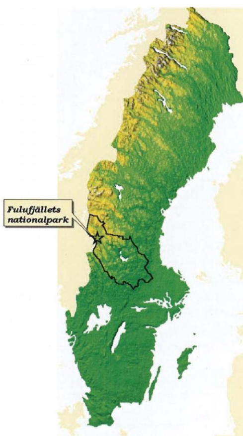
Figur 1: Fulufjällets geografiska läge (Naturvårdsverket 2002:6)

Områdena kring Fulufjället utgör ett mångfunktionellt landskap där friluftsliv, turism, naturvård, rekreation, jakt, fiske, skogsbruk, lantbruk och rennäring behöver samverka. Fulufjället, beläget i Älvdalens kommun i Dalarnas Län (se figur 1), tillhör fjällkedjans allra sydligaste områden. Fulufjället beskrivs som ett isolerat, flackt fjällmassiv med bergstoppar runt 1000 meter över havet (Naturvårdsverket 2002). Fulufjället ligger på svensk-norska gränsen, och betydande arealer återfinns på norska sidan av fjället. Den norska delen av Fulufjället har varit nationalpark sedan 2012 (Miljøverndepartementet 2012). De 38 000 hektar som utgör dagens nationalparken i Sverige har i stort sett varit skyddade som naturreservat sedan 1970 talet. Minst 2200 hektar var planerade att förvärfvas i samband med nationalparksbildningen (Wallsten 2012). Området har varit utpekad som riksintresse för naturvård och friluftsliv sedan år 1988 respektive år 2000 (2002:69-71). Fulufjällets nationalpark är idag Sveriges femte största nationalpark som ligger på fastlandet. De 4 största ligger i Norrbottens län.